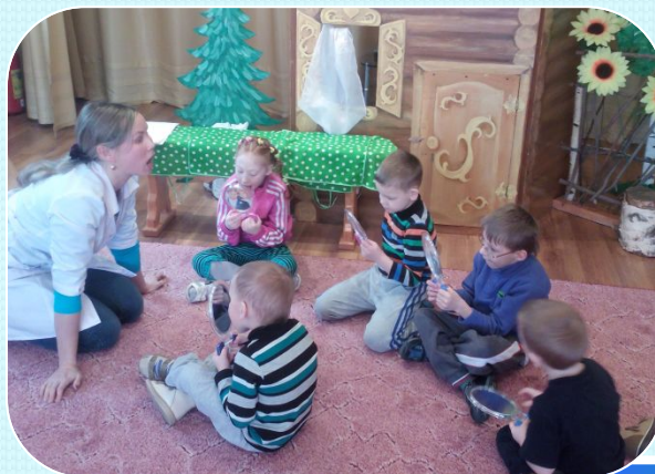
Массаж по биологически активным точкам