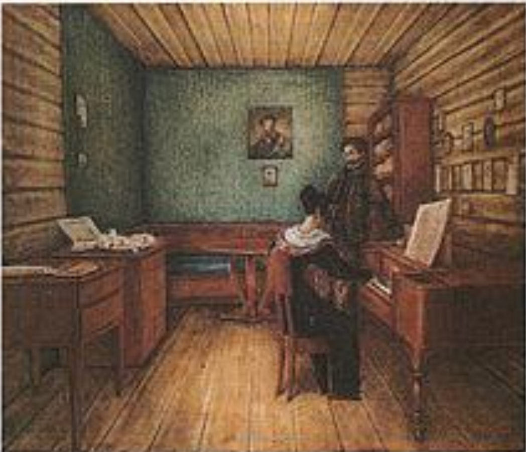
М.Волконская с мужем в камере тюрьмы.