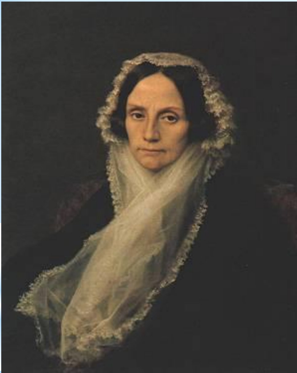
М.Н. Волконская- в старости