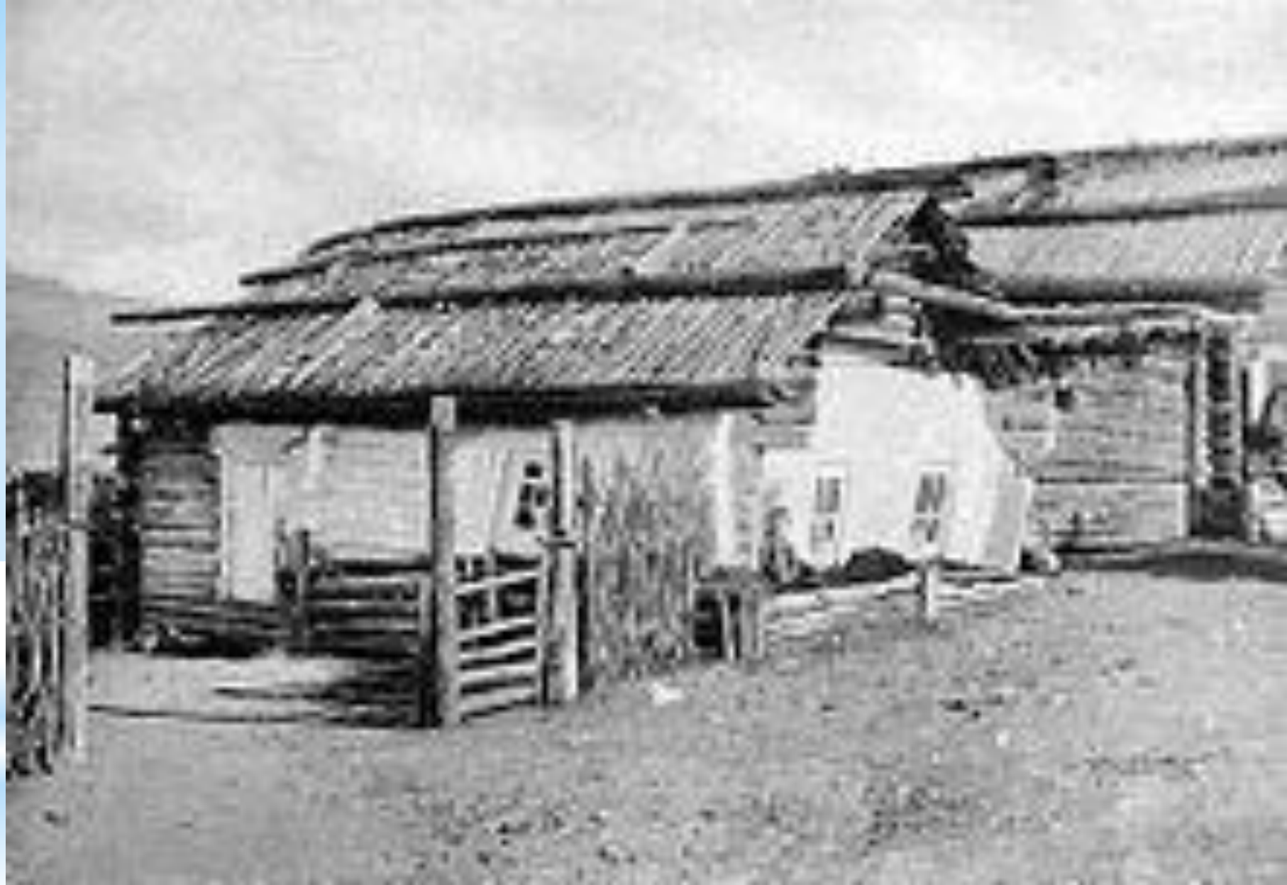
Дом Волконской и Трубецкой.