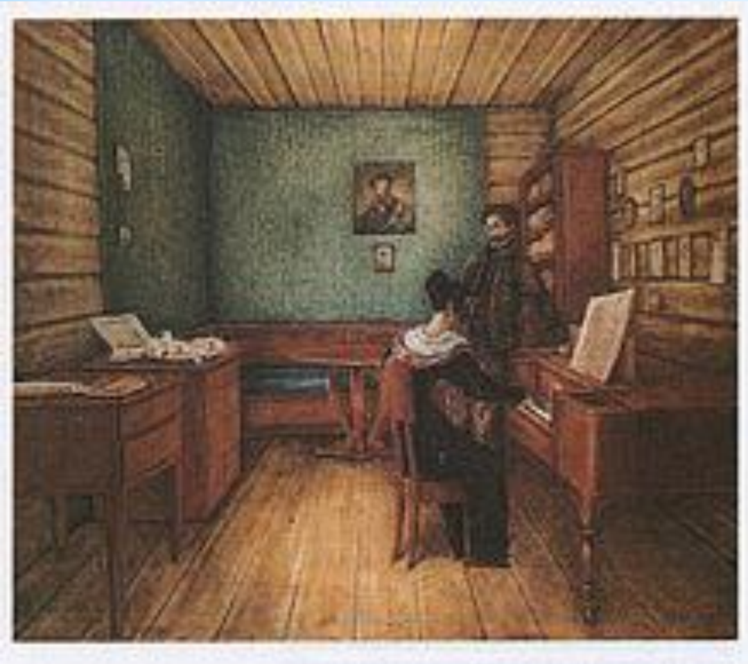
М.Волконская с мужем в камере тюрьмы.