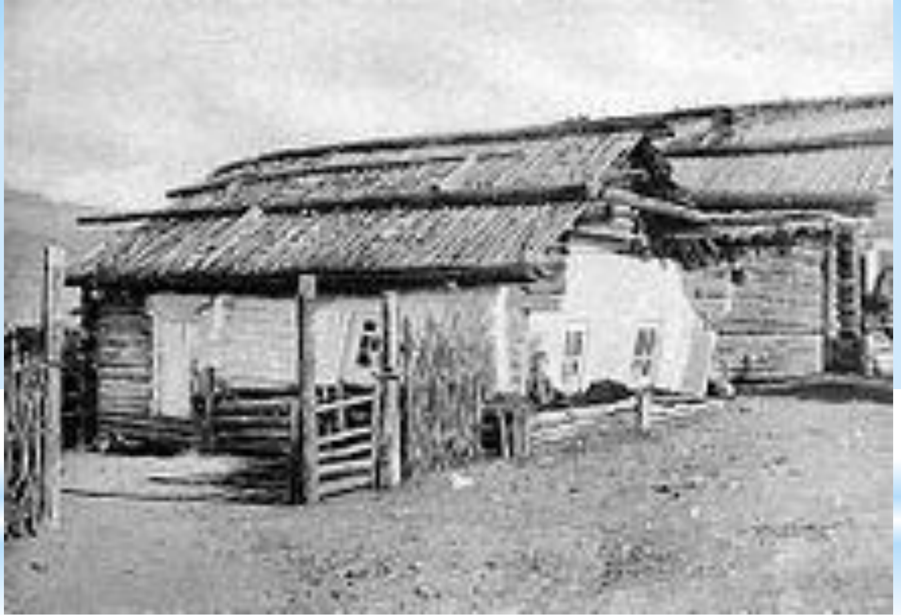
Дом Волконской и Трубецкой.