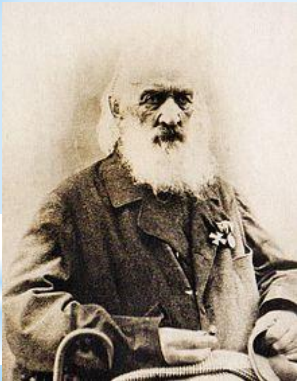
Волконский С.Г. – в старости.