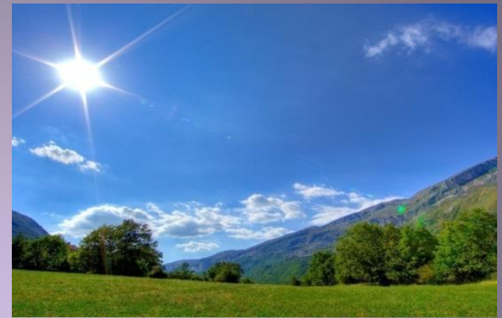
День (какой?) солнечный