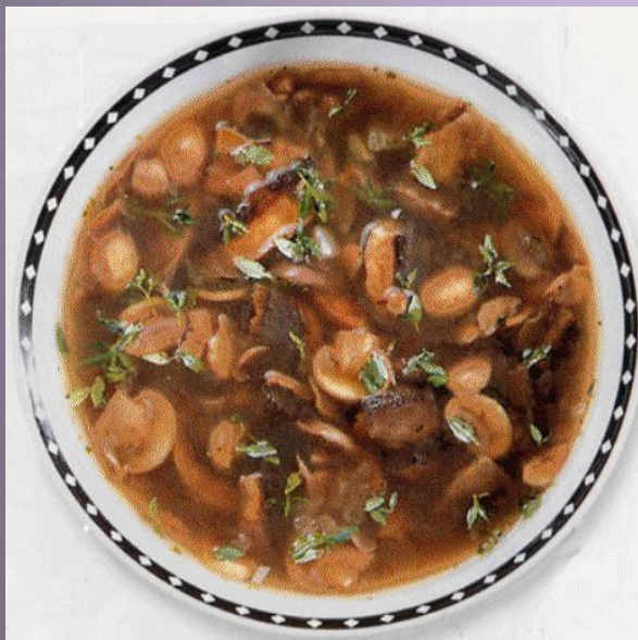
Суп (какой?) грибной