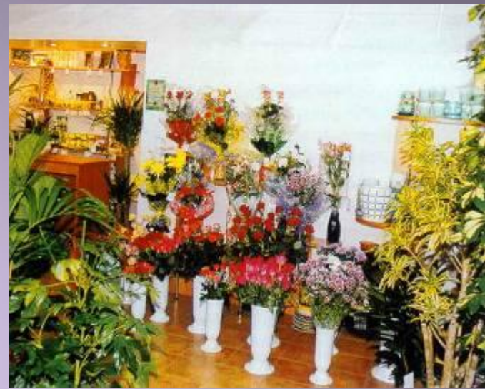
МАГАЗИН (КАКОЙ?) ЦВЕТОЧНЫЙ