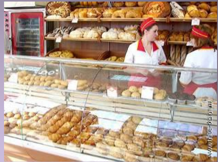
Магазин (какой?) хлебный