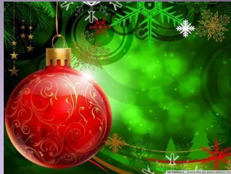
Шар (какой?) ёлочный