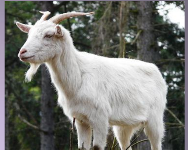
Коза (какая?) рогатая