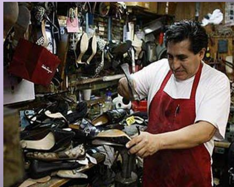
Мастерская (какая?) сапожная