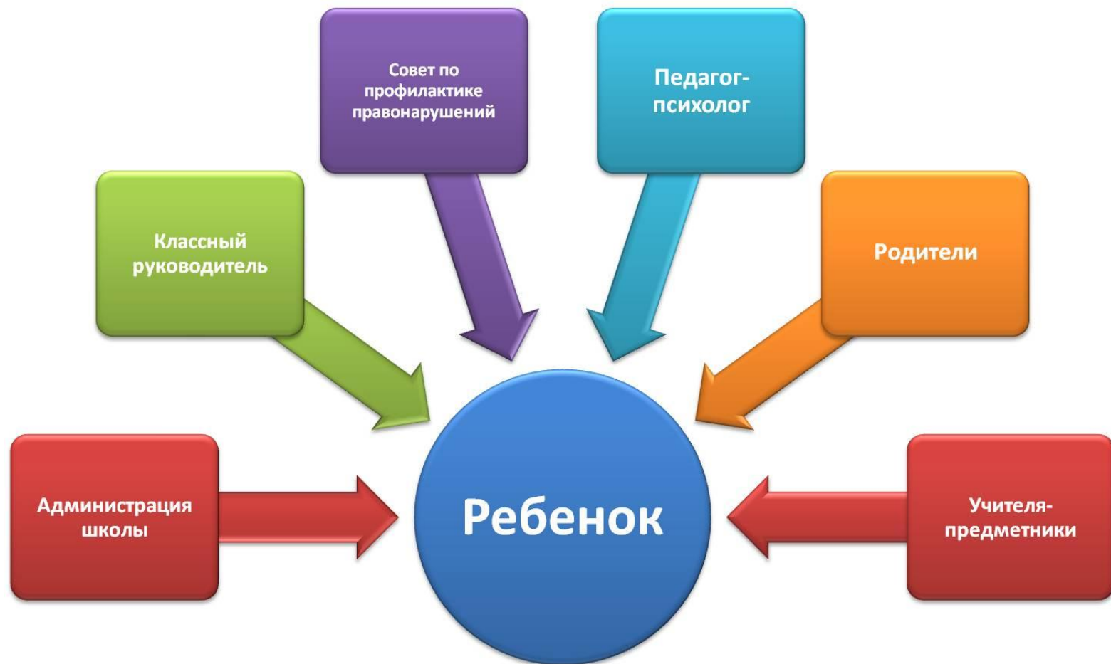
СХЕМА СОТРУДНИЧЕСТВА УЧАСТНИКОВ ВОСПИТАТЕЛЬНОГО ПРОЦЕССА ПО ПРОФИЛАКТИКЕ ПРАВОНАРУШЕНИЙ, БЕЗНАДЗОРНОСТИ СРЕДИ НЕСОВЕРШЕННОЛЕТНИХ