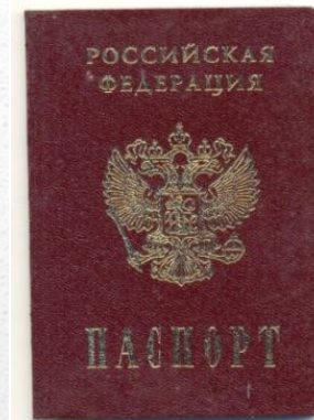
Паспорт гражданина РФ