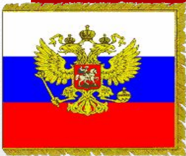
Штандарт Президента РФ