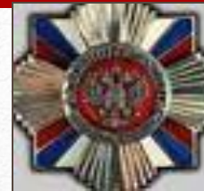
Орден «За военные заслуги»