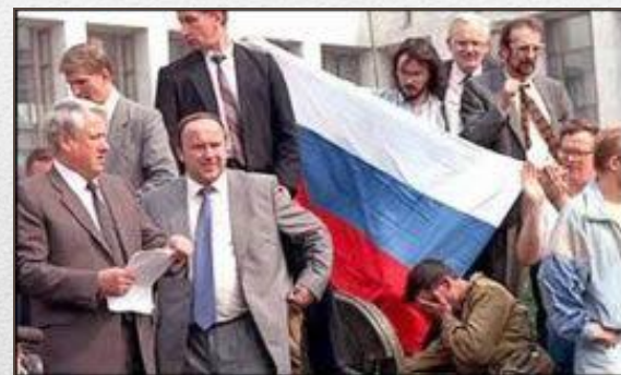
После августовского путча. 1991 год