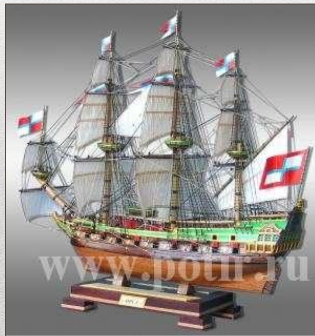
Макет корабля «Орёл»