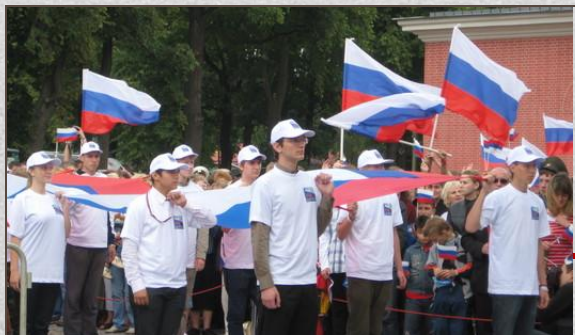
Празднование дня Государственного флага.

День Государственного Флага Российской Федерации отмечается ежегодно 22 августа.