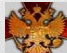
Эмблема таможенной службы РФ