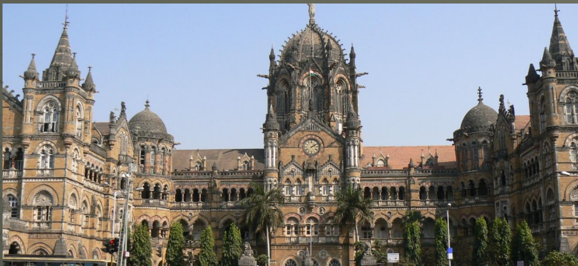
Самый красивый: Виктория Терминус в Бомбее