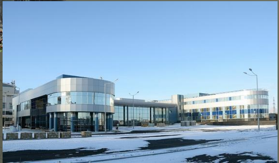
Самый родной: Уренгойский вокзал