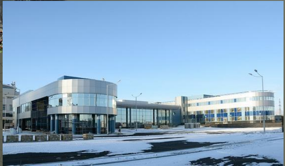
Самый родной: Уренгойский вокзал