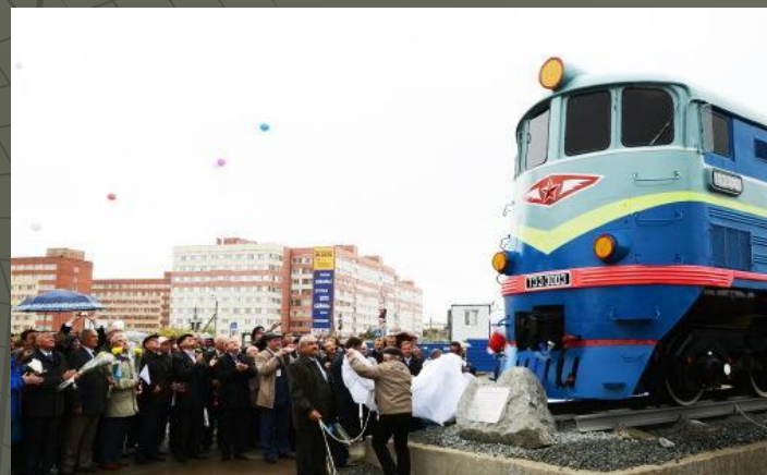
Открытие памятного знака»Локомотив ТЭЗ"