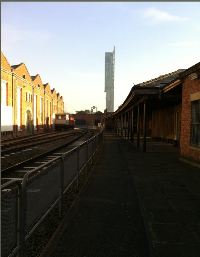
Самый старый: Ливерпул-Роад в Манчестере.