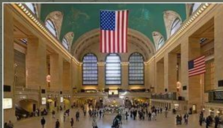
Самый большой в мире: Нью-йоркский вокзал Гранд-Централ