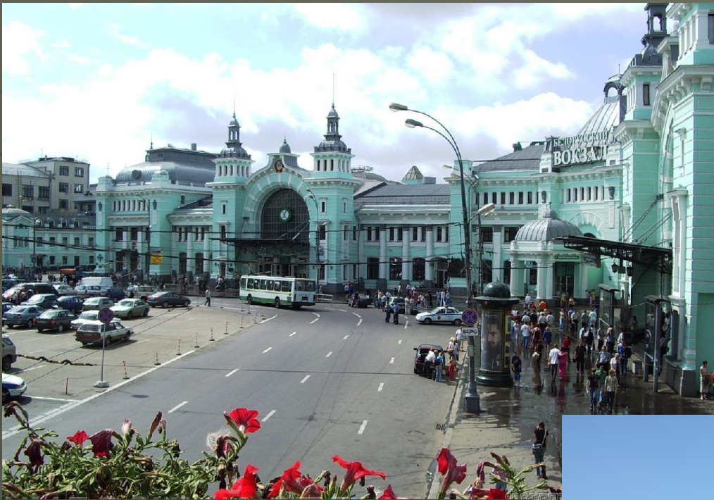
Самый популярный в России: Белорусский вокзал в Москве