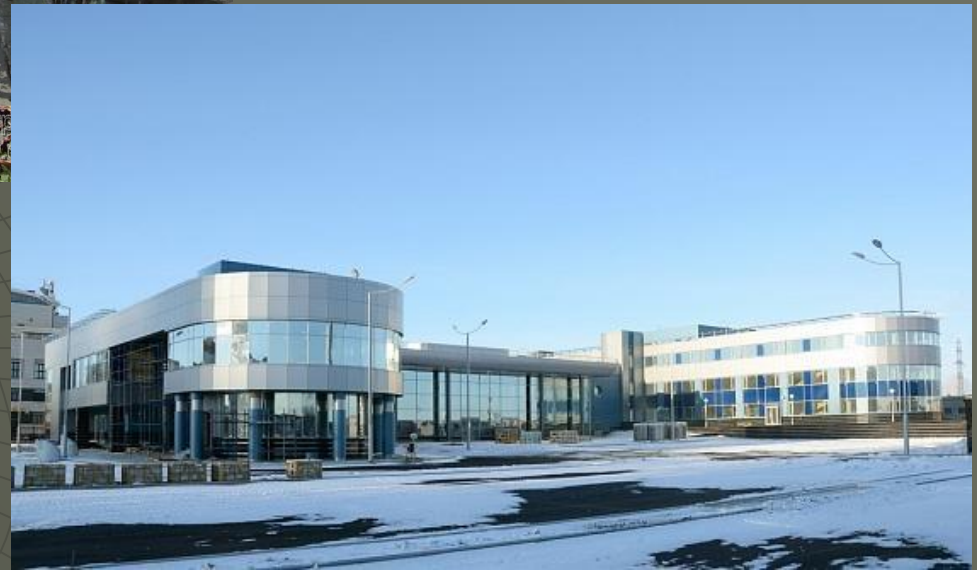
Самый родной: Уренгойский вокзал