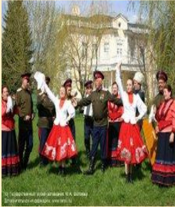
12 Традиционный танец ансамбля в А. Шолоха Домовладение в селе Яковлевское