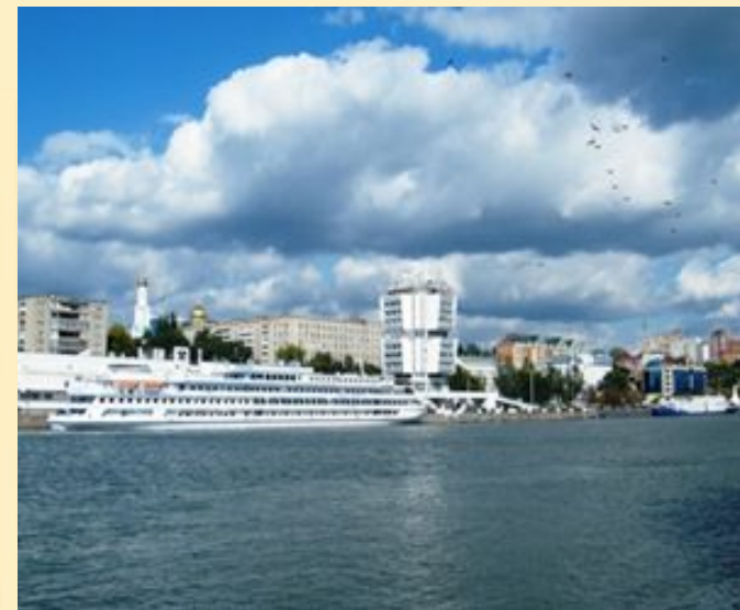
Ворота Кавказа - мост через Дон и вид на Ростов-на-Дону с левого берега