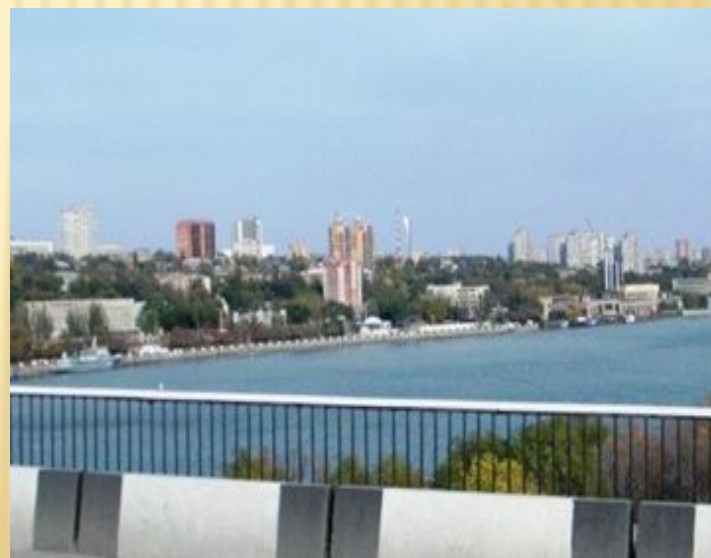
Дон, вниз и вверх от Ростова-на-Дону