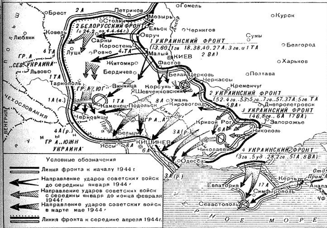
Освобождение Правобережной Украины и Крыма