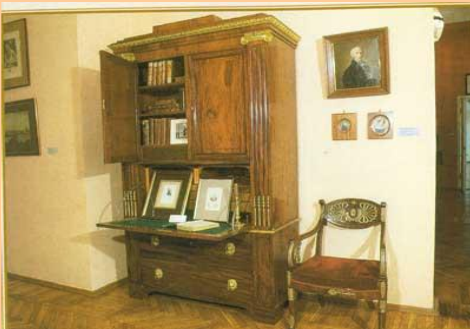
Фрагмент экспозиции «Н.М.Карамзин – русской истории подвижник».