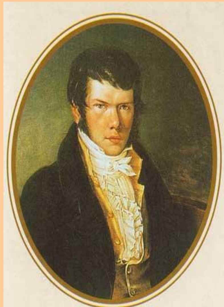
Князь Петр Андреевич Вяземский