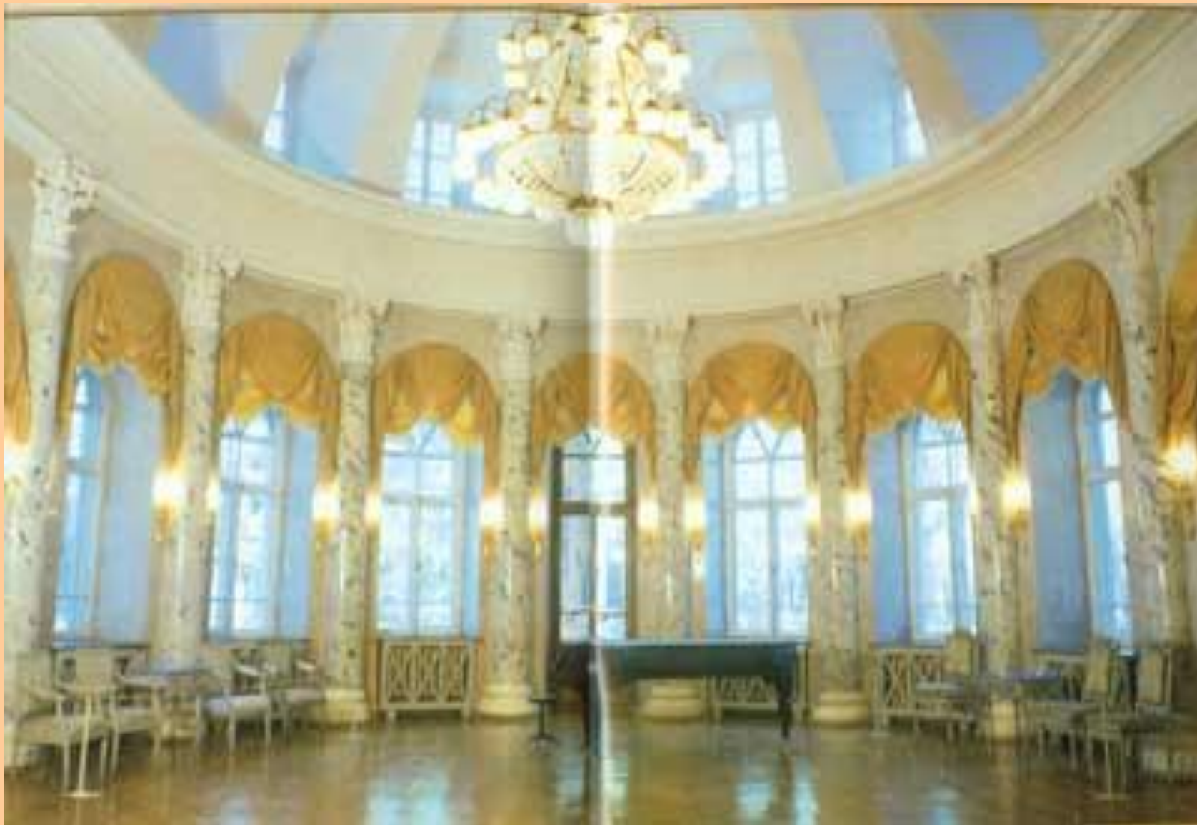
Главный усадебный дом. Овальнй зал