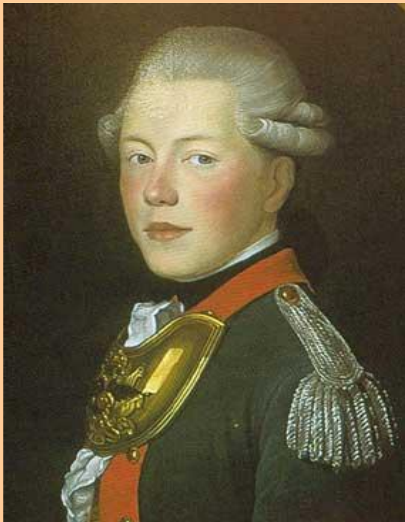
Князь Андрей Иванович Вяземский