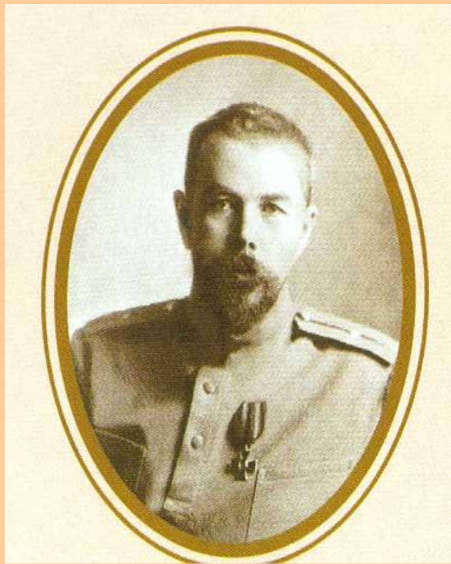
Граф Павел Сергеевич Шереметев