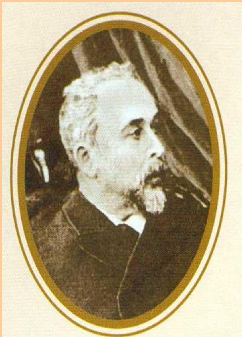
Граф Сергей Дмитриевич Шереметев