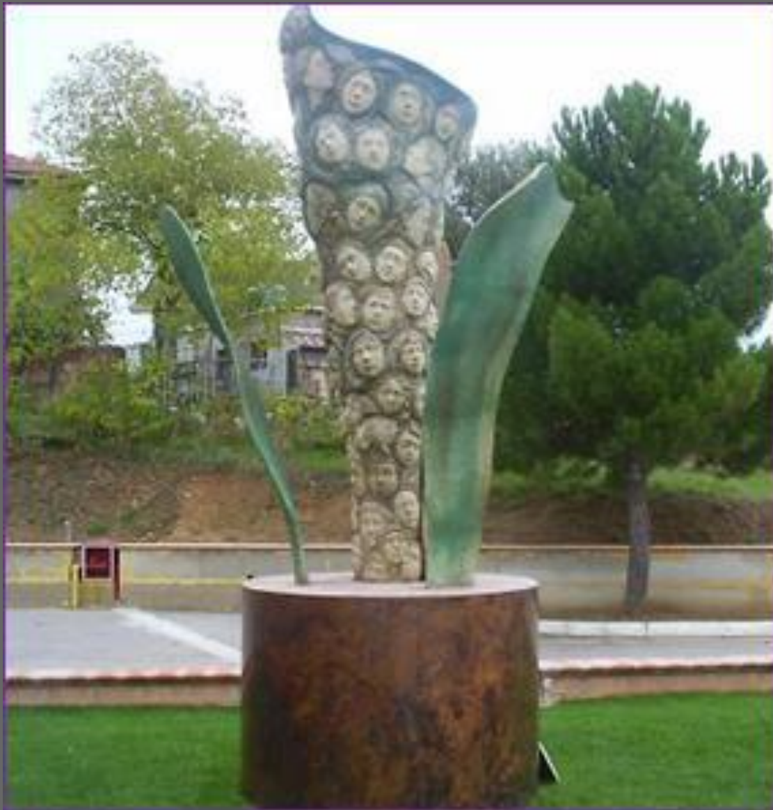
Памятник погибшим в Беслане детям (провинция Кьети, Италия)