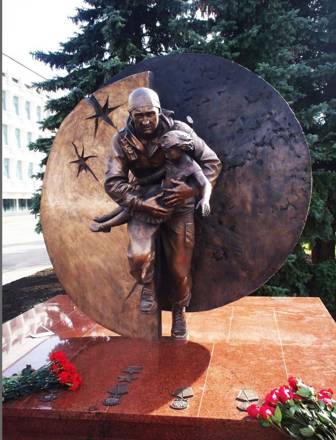
Памятник герою России Дмитрию Разумовскому