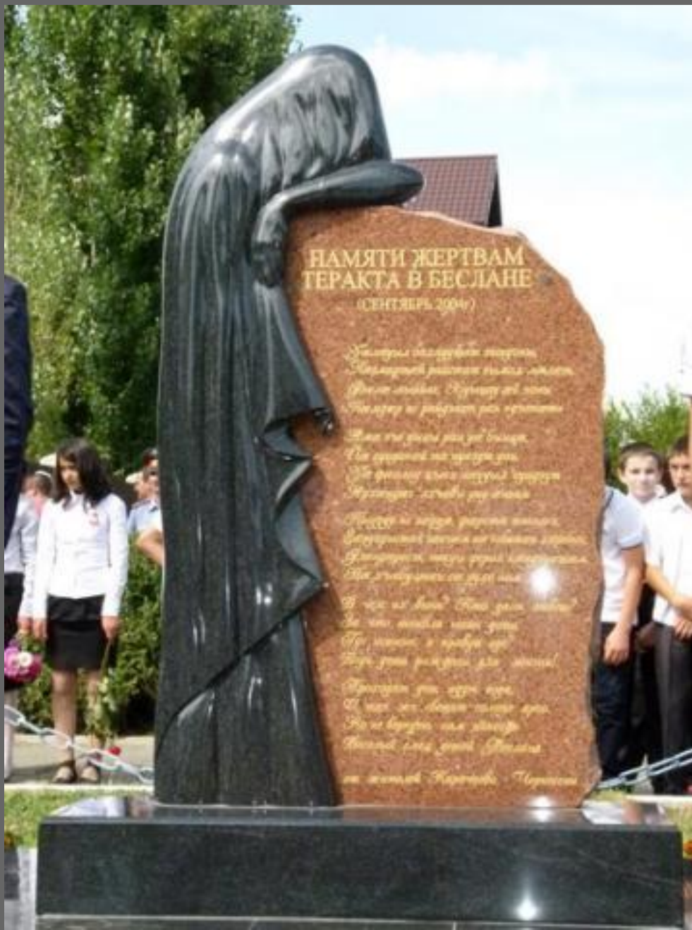
Памятник жертвам теракта в Беслане (с. Коста-Хетагурово, Карачаево-Черкесия)