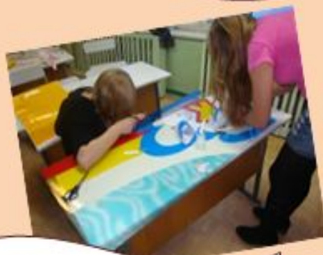
Вместе весело творить!!!