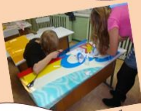
Вместе весело творить!!!