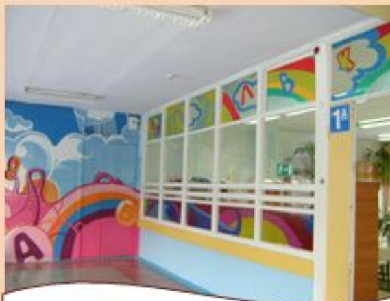
Первый модуль готов