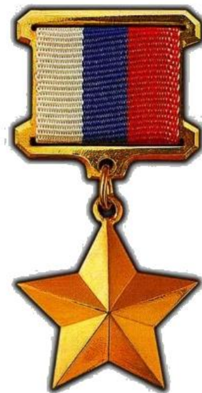
ГЕРОЕВ РОССИЙСКОЙ ФЕДЕРАЦИИ