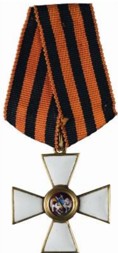
КАВАЛЕРОВ ОРДЕНА СВЯТОГО ГЕОРГИЯ