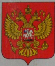
Государственный герб Российской Федерации