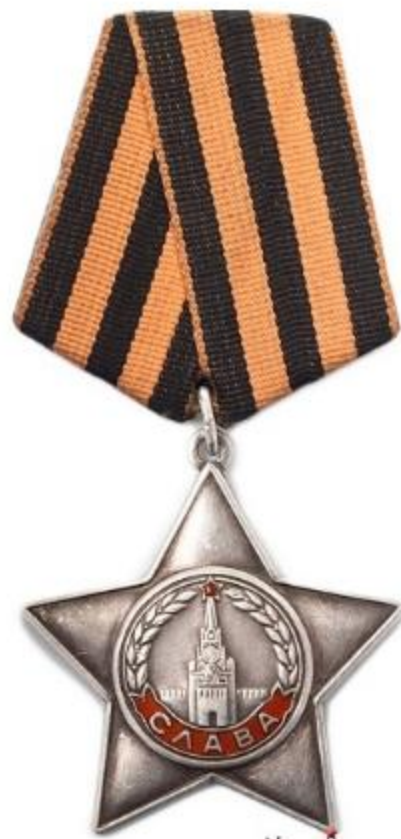
КАВАЛЕРОВ ОРДЕНА СЛАВЫ