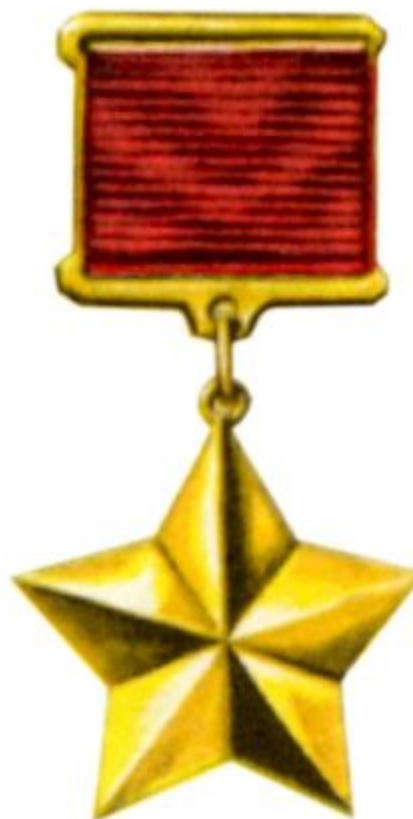
ГЕРОЕВ СОВЕТСКОГО СОЮЗА