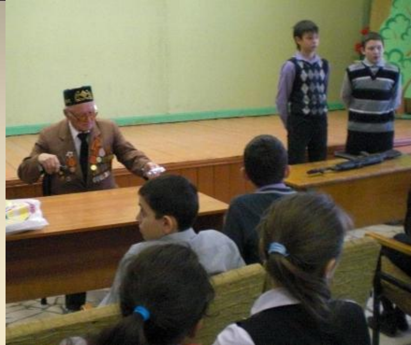
Встреча с ветераном Великой Отечественной войны