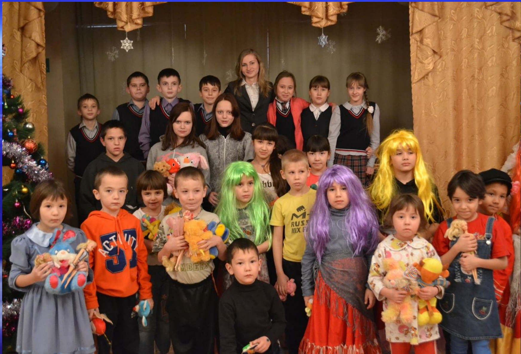
Центр помощи детям "Надежда" с.Урман-Бишкадак