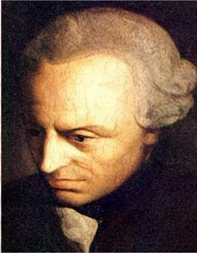
Иммануи́л Кант ( 22 апреля 1724 — 12 февраля 1804 ) — немецкий философ

«Допустима ли ложь во спасение? Нет! Нельзя помыслить себе решительно ни одного случая, когда была бы оправдана ложь. В противном случае дети любое обстоятельство станут расценивать как то именно, при котором позволительна ложь во спасение».