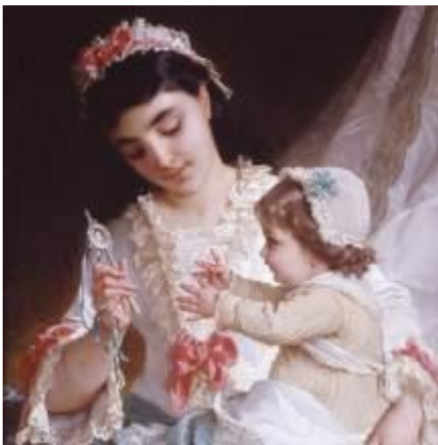
Художник Эмиль Мунье