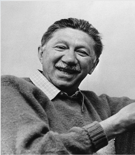
Абрахам Маслоу (1908-1970), американский психолог