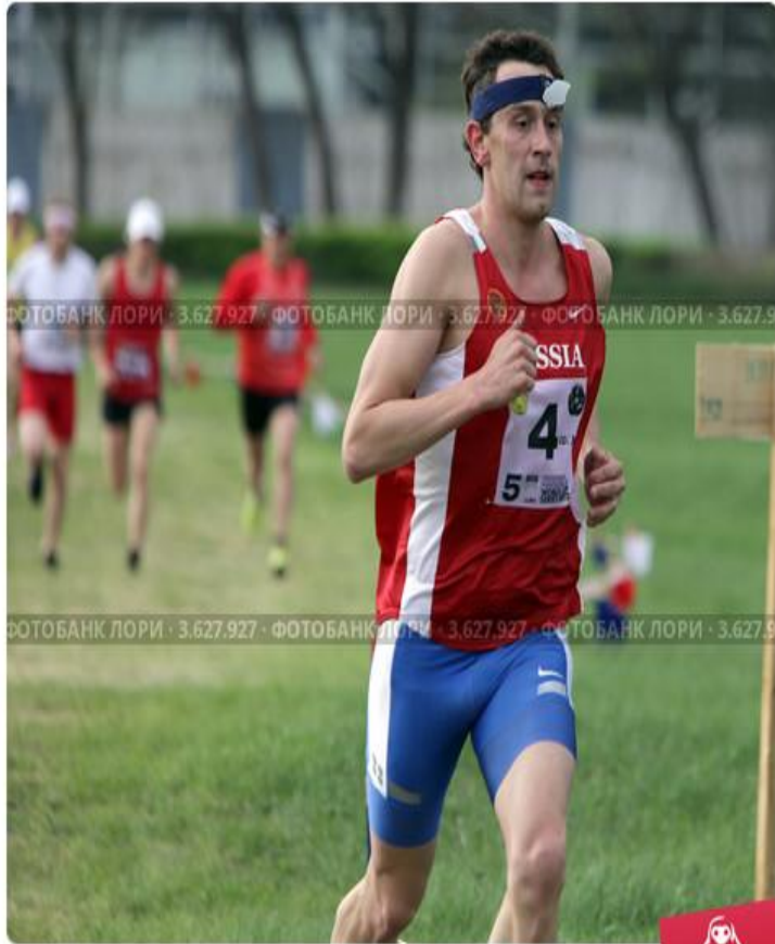
Ростов-на-Дону. Этап Кубка мира по современному пятиборью