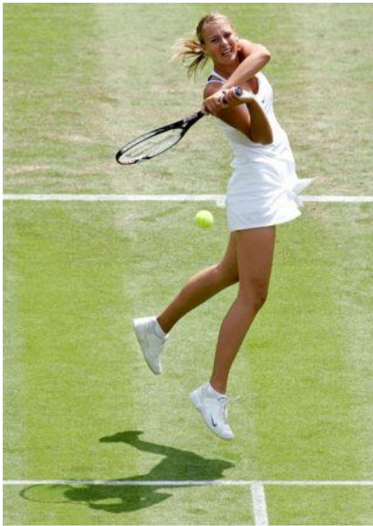
МАРИЯ ШАРАПО ВА