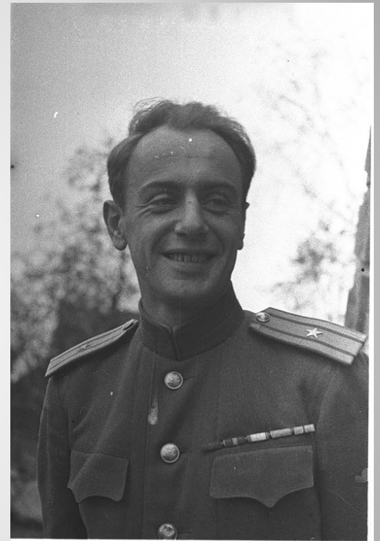
Поэт Евгений Долматовский

Песня еще одной неразрывной связью скрепила фронт и тыл.