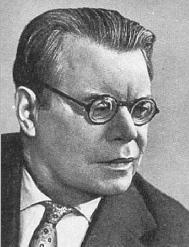
Михаил Исаковский 1900-1973г.г.

Большое место в его творчестве занимают патриотические стихи о Великой Отечественной войне 1941—45, о героизме советских людей на фронте и в тылу. Многие стихи, положенные на музыку, стали популярными народными песнями, они поются во всём мире: