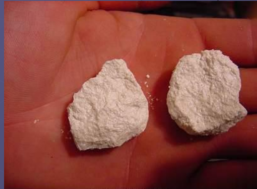
Pressed powder Cocaine (1/2 oz)