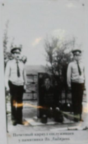
Почетный караул сослуживцев у памятника Вл. Лиджиева