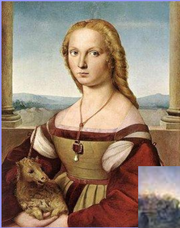
Дама с единорогом