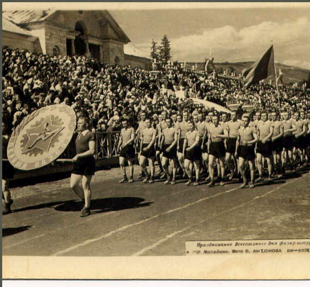
Празднование Всесоюзного дня физкультуры в г. Магадане. ИМ-00831