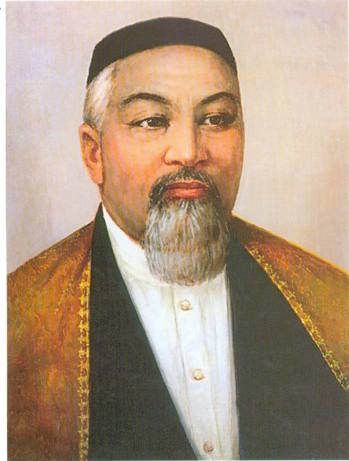
АБАЙ (ИБРАГИМ) ҚҰНАНБАЕВ

Жас бала анадан туғанда екі түрлі мінезбен туады. Біреуі – ішсем, жесем, ұйықтасам деп тұрады. Біреуі білсем екен демекілік. Не көрсе соған талпынып, “ол немене?”, “бұл немене?” деп, “ол неге үйтеді?”, “бұл неге бүйтеді?” деп, көзі көрген, құлағы естігеннің бәрін сұрап, тыныштық көрмейді. Мұның бәрі – білсем екен, көрсем екен, үйренсем екен дегені.