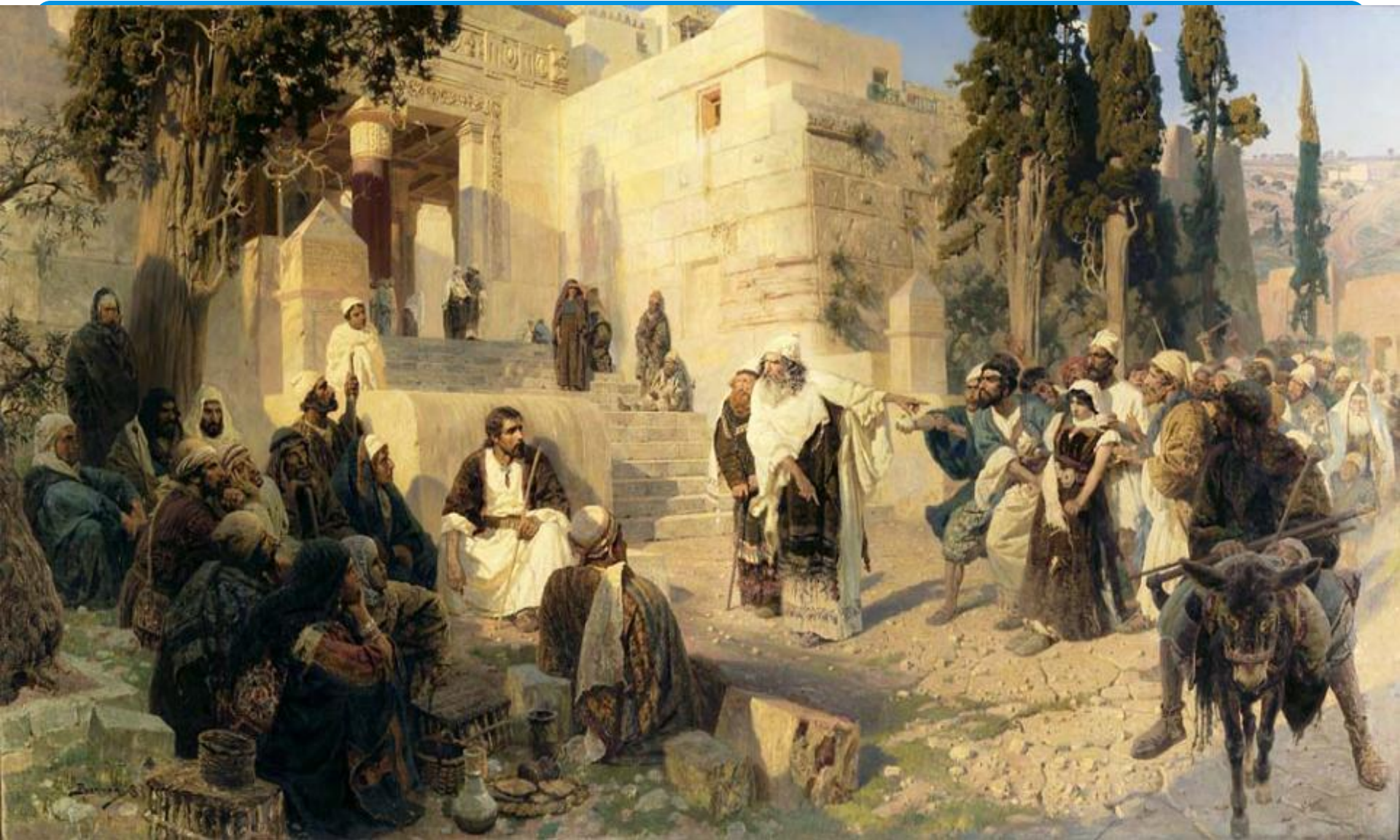
Поленов В.Д. «Христос и грешница»