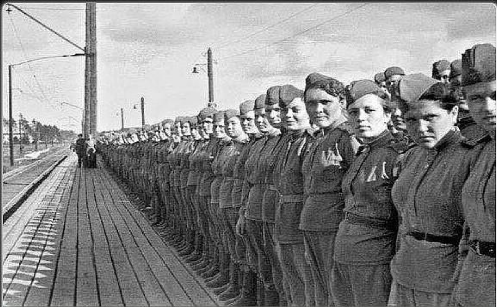
Девушки-снайперы перед отправкой на фронт. 1943 год.