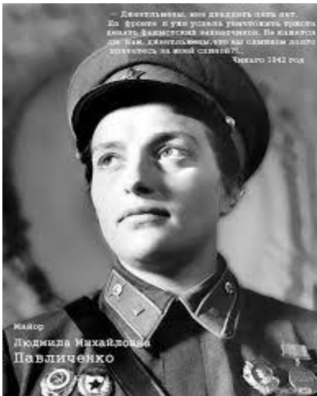
Майор Людмила Михайловна Павличенко