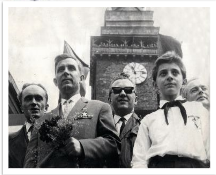
1968г., Чехословакия, г. Пардубице