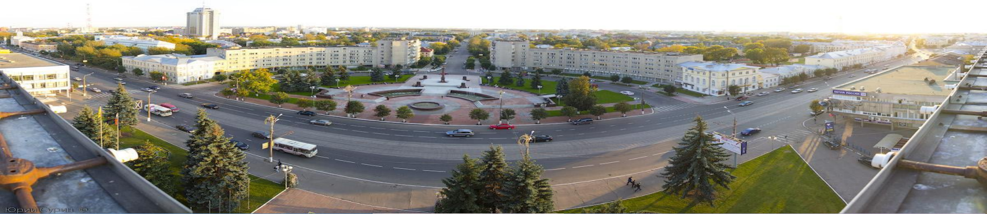
Юрий Сурин ©