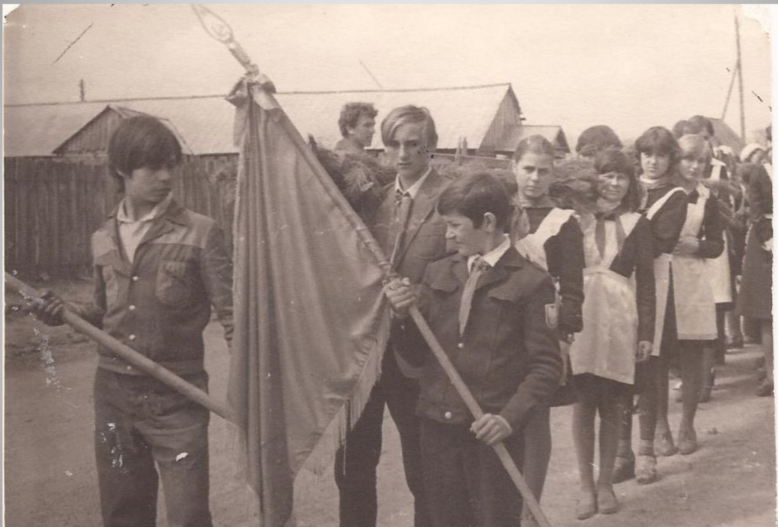
Возложение гирлянды к обелиску