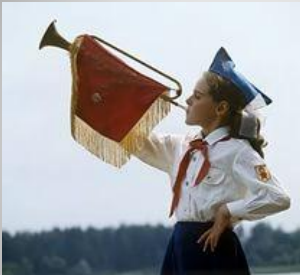
Парадная форма пионера