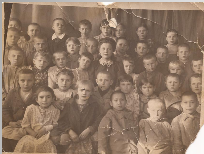
Начальная школа 1941-42 год