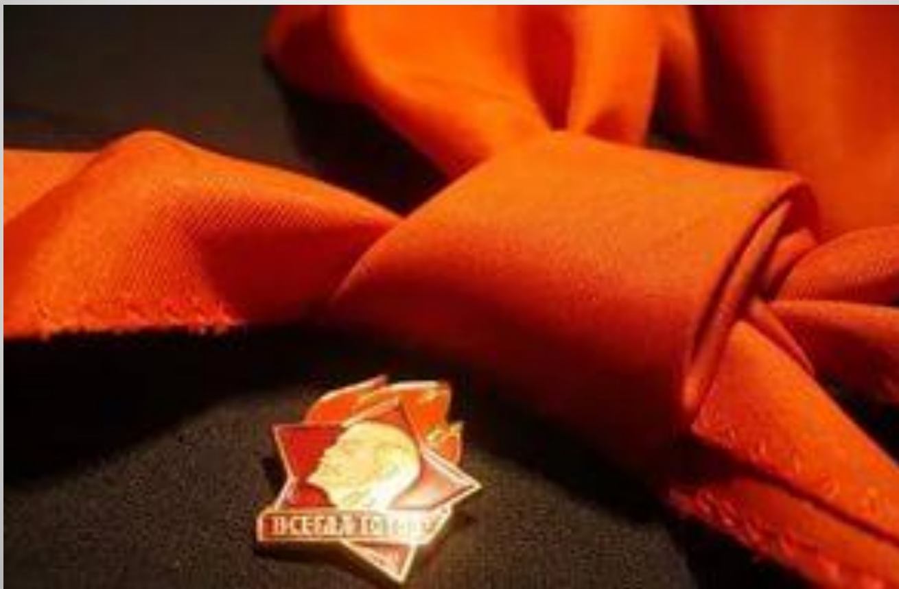
Пионерский галстук, значок.