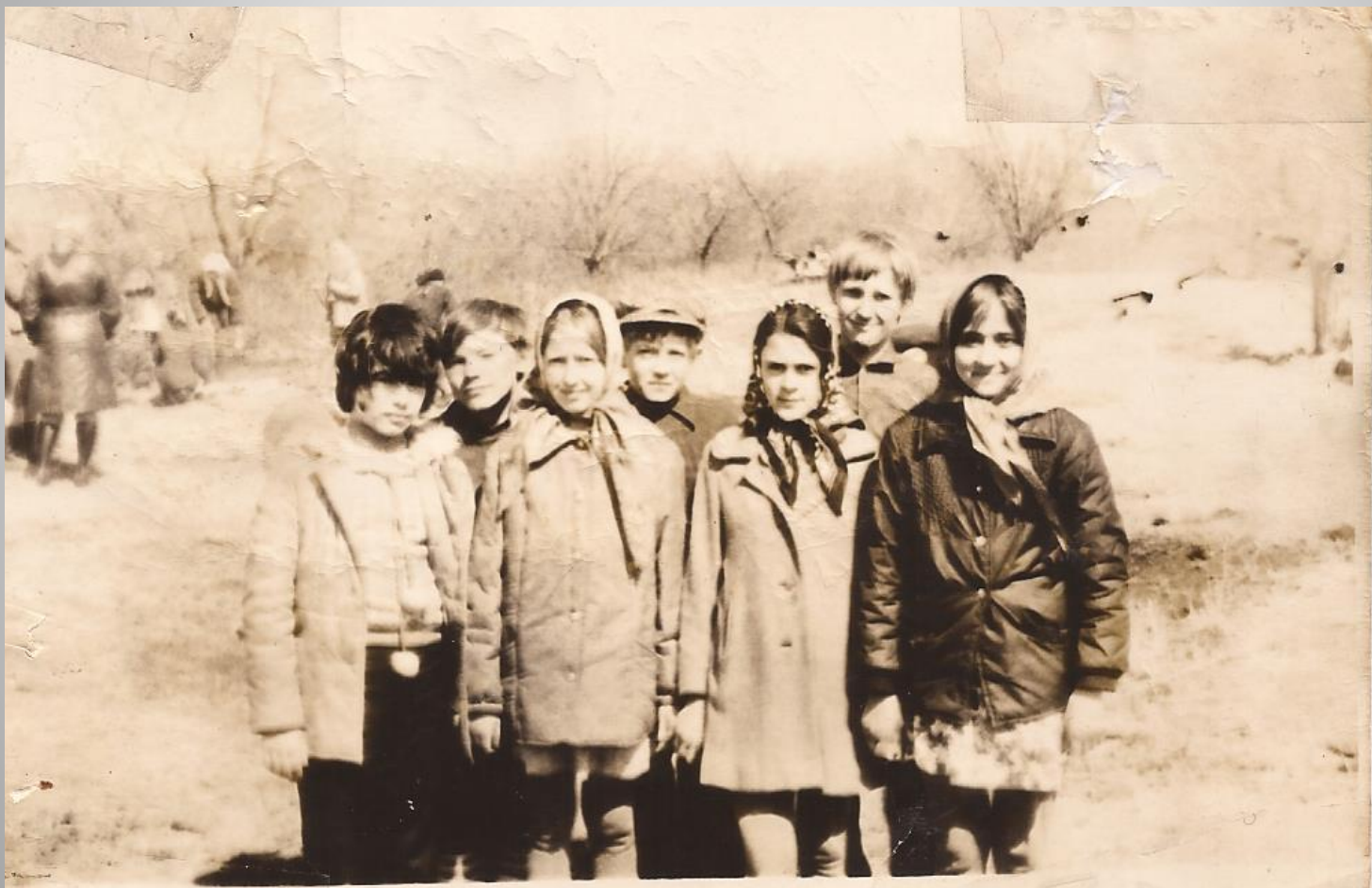
Собираем урожай смородины