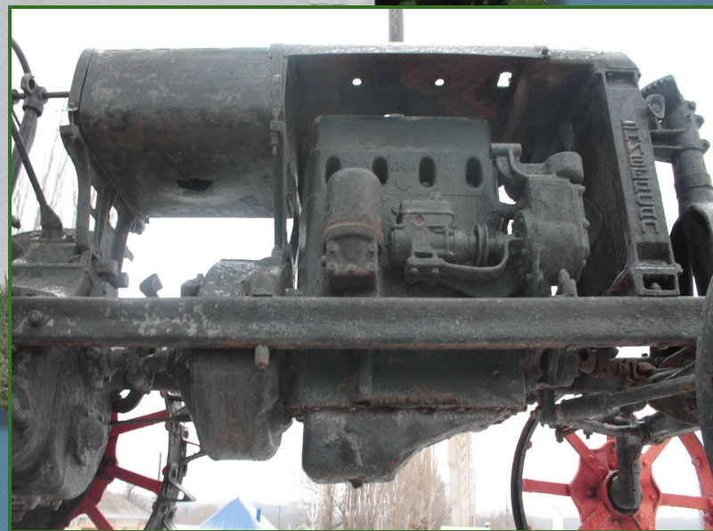
Трактор «Универсал – 2»