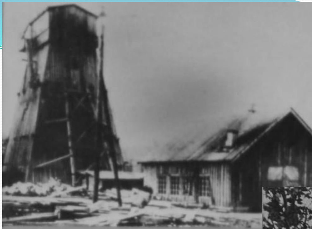
ШАХТА „КАПИТАЛЬНАЯ-2“ ПРОХОДЧЕСКИЙ КОПЕР