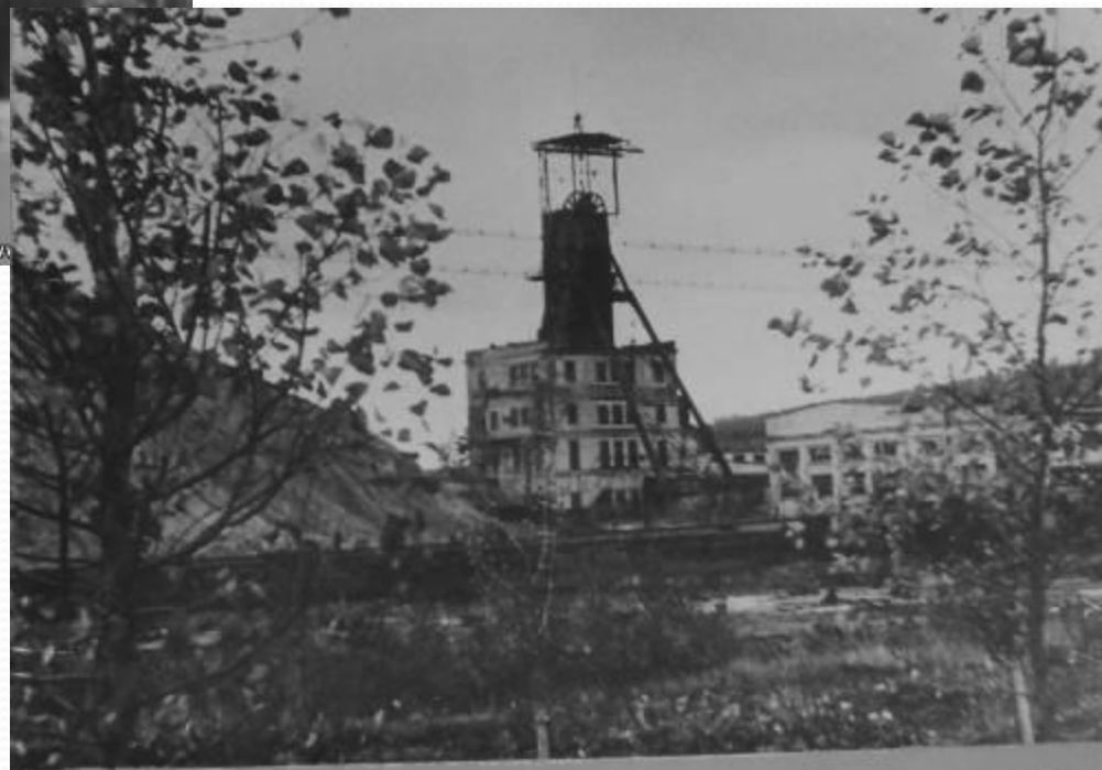
ОБЩИЙ ВИД ШАХТЫ „КАПИТАЛЬНАЯ-2“