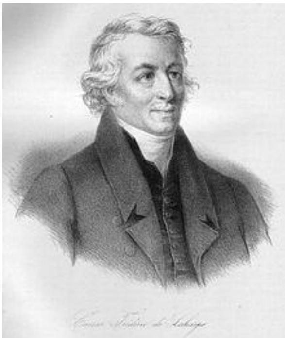
Фредерик Сезар Лагарп

Одной из заметных фигур среди воспитателей императора был Фредерик Лагарп.