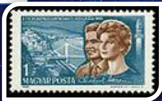
Почтовая марка Венгрии, 1965 год