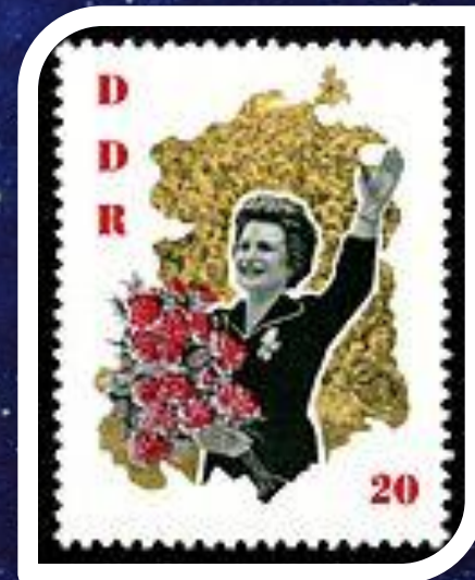
Почтовая марка ГДР, 1963 год