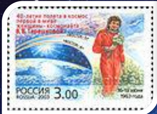
Сцепка почтовых марок СССР, 1963 год