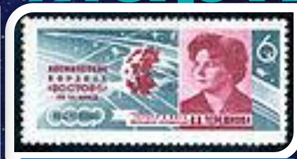
Почтовая марка СССР, 1963 год