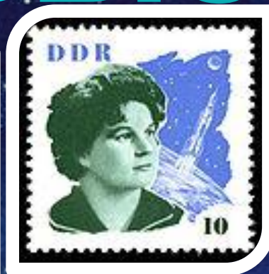
Почтовая марка ГДР, 1963 год