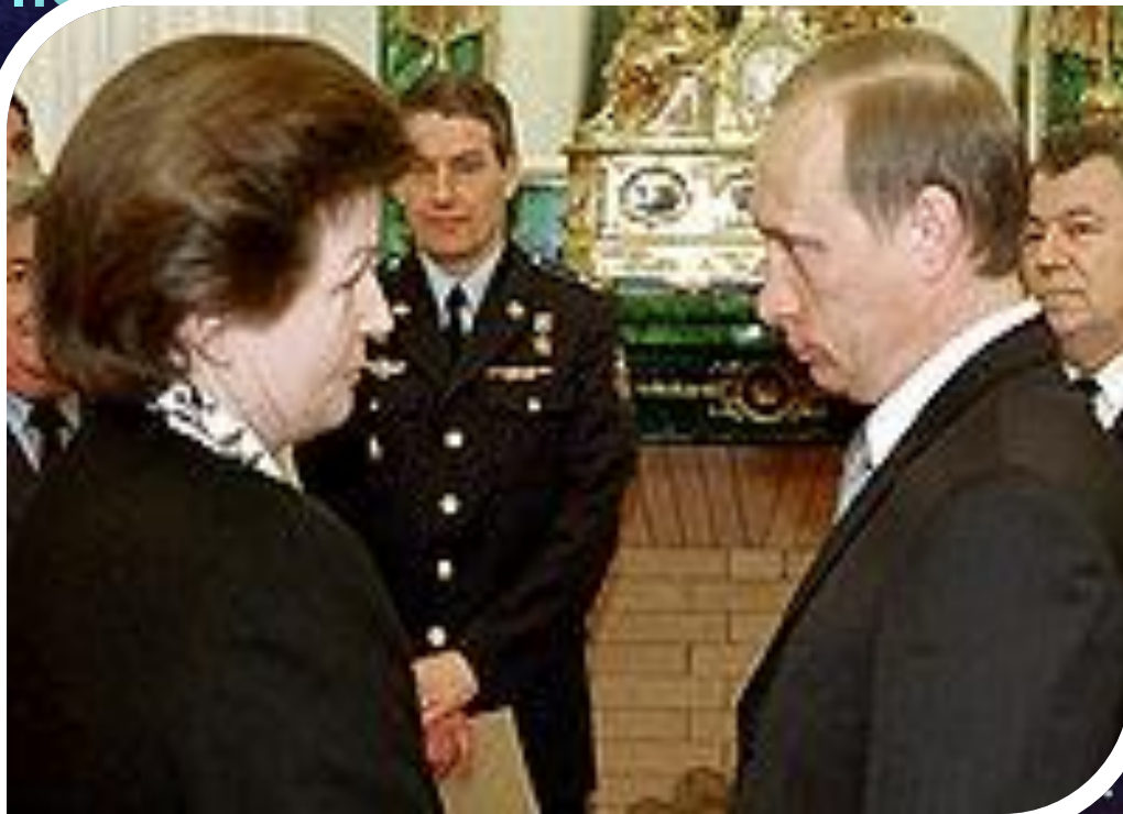
Валентина Терешкова и Владимир Путин. 2000 год