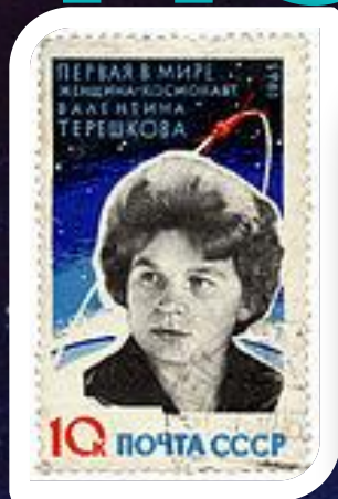
Почтовая марка СССР работы Лесегри, 1963 год