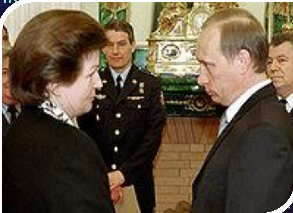
Валентина Терешкова и Владимир Путин. 2000 год