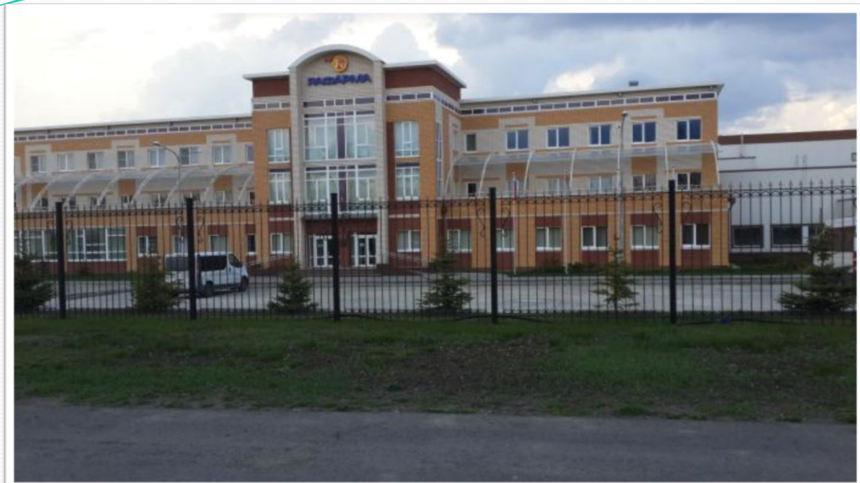
Производственный комплекс «Рафарма»