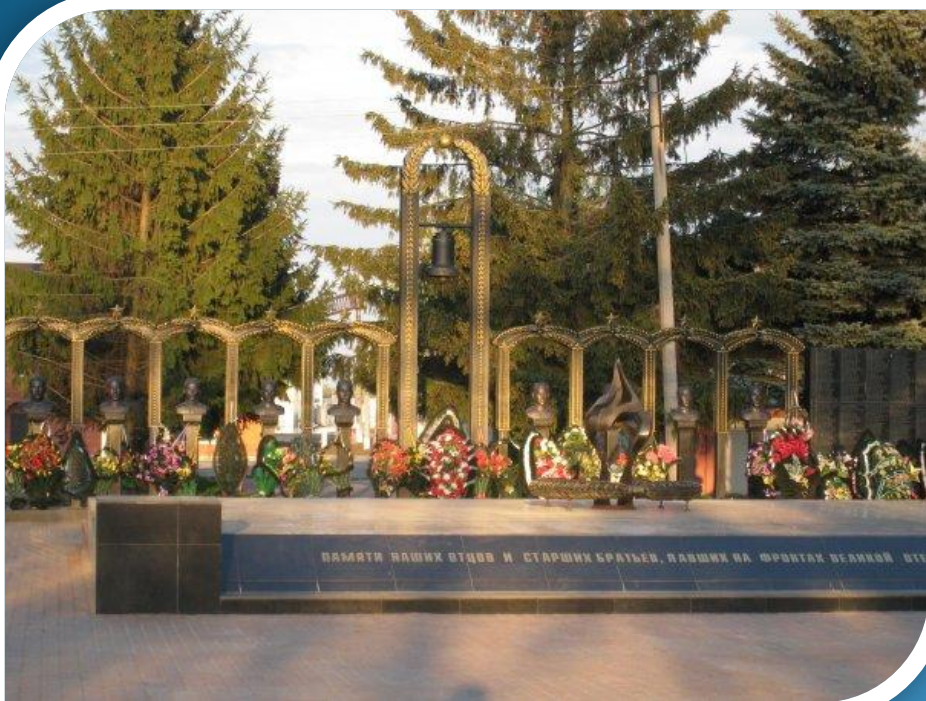
Мемориал героев- земляков