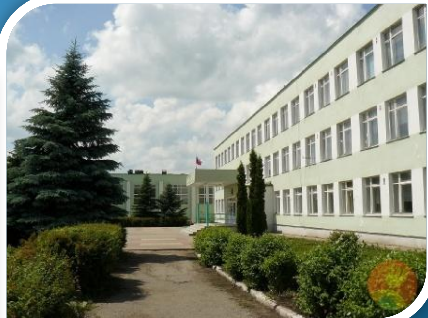
МБОУ СОШ с. Тербуны