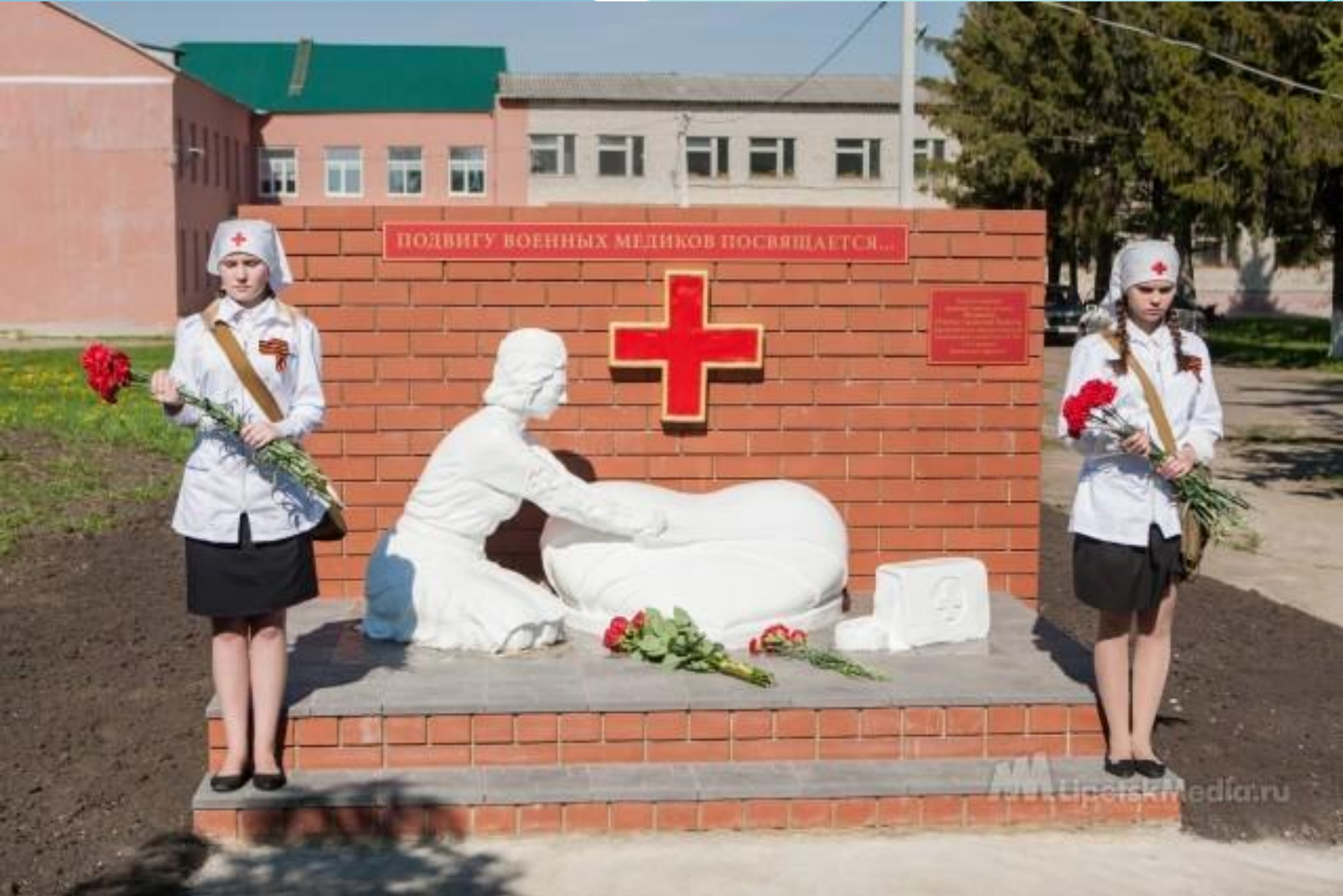
Памятник военным медикам