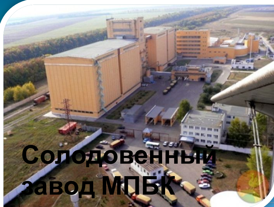
Солодовенный завод МПБК «Очаково»