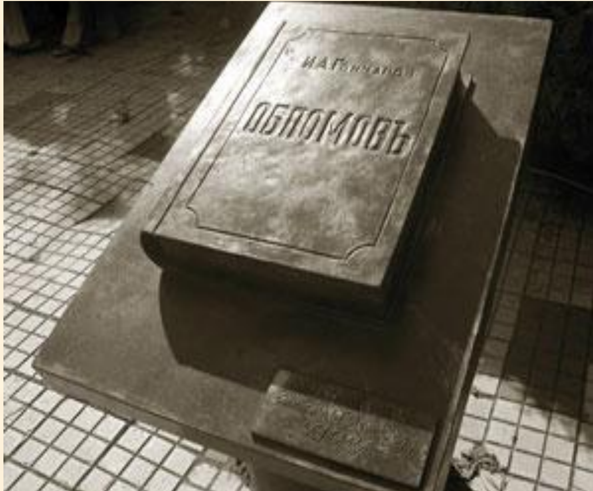
Ульяновск (Симбирск), Россия