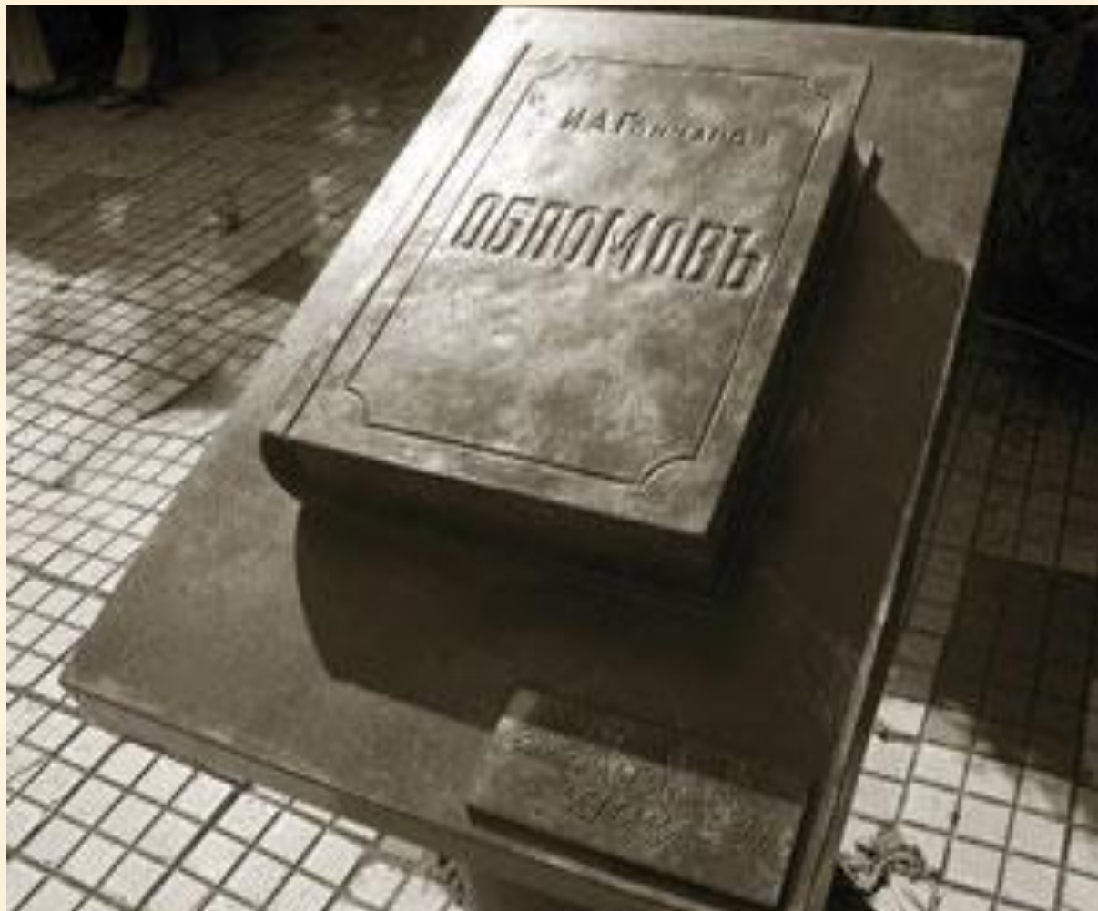
Ульяновск (Симбирск), Россия