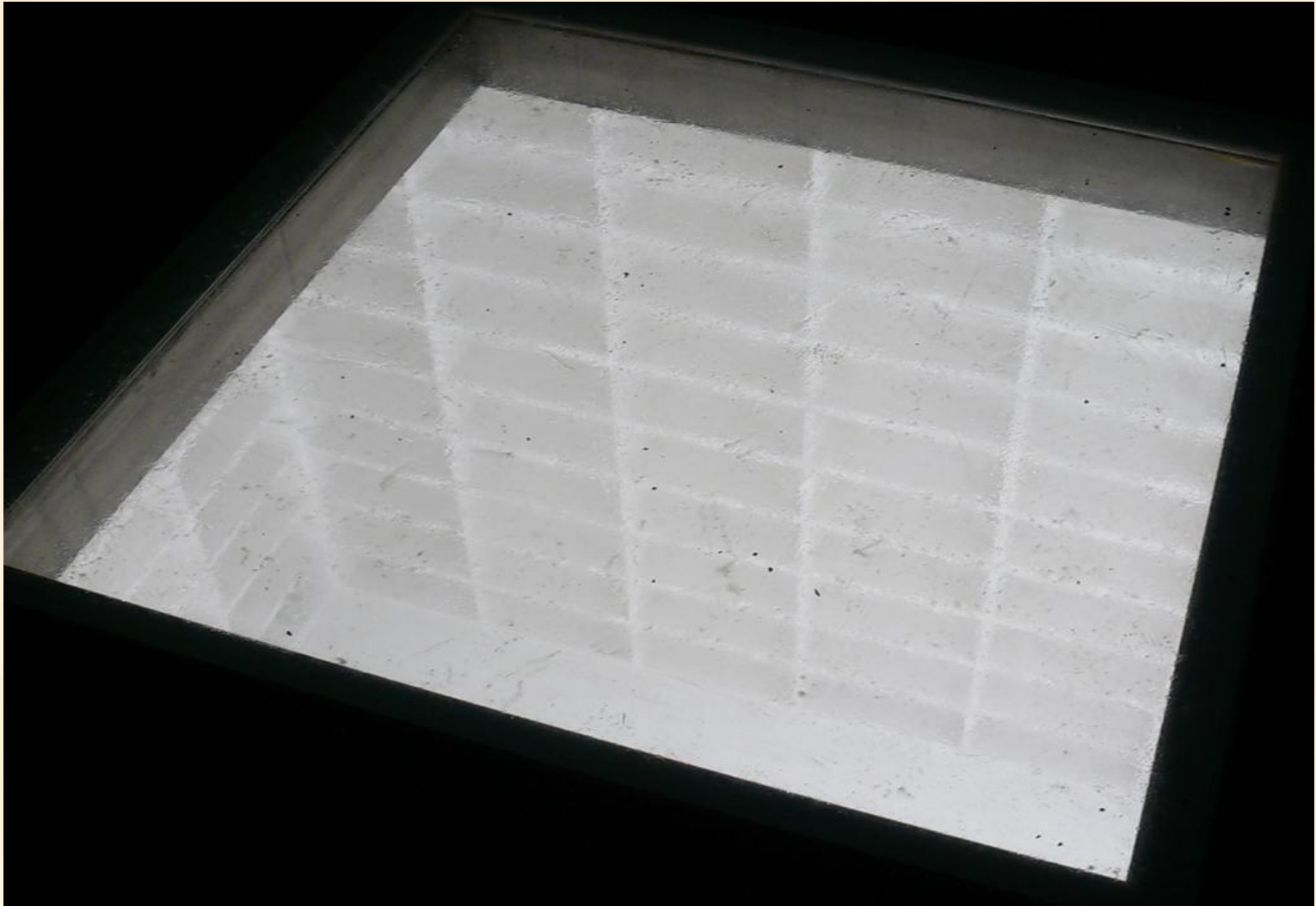
Памятник «Замученной книге» на площади Бабельплатц в Берлине