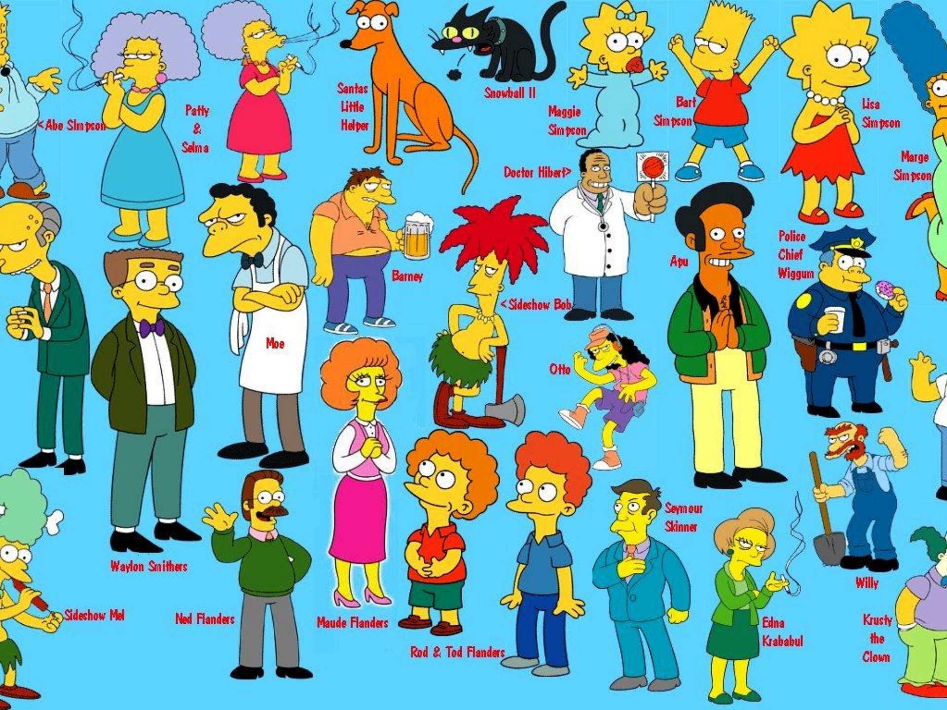
< Abe Simpson