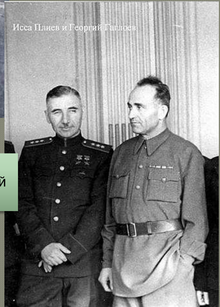
Исса Плиев и Георгий Гаглоев