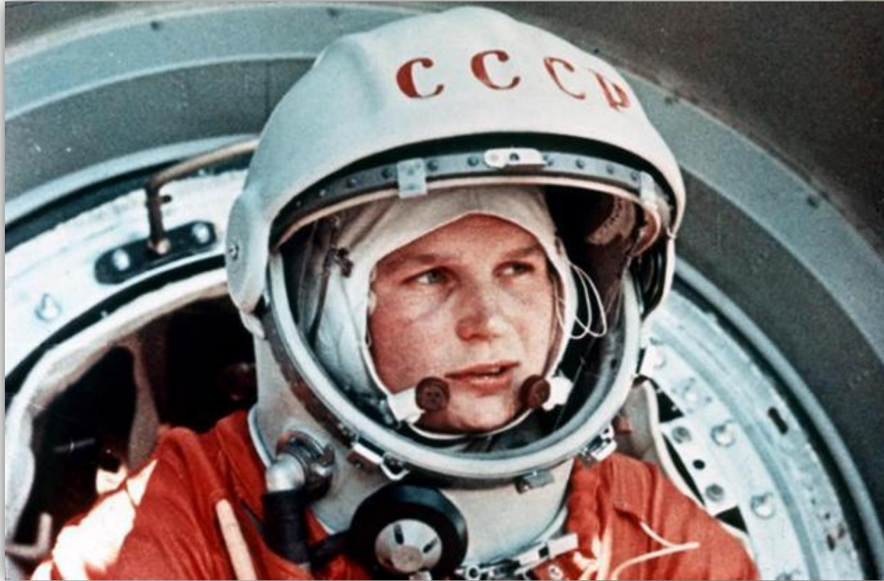
Валентина Владимировна ТЕРЕШКОВА