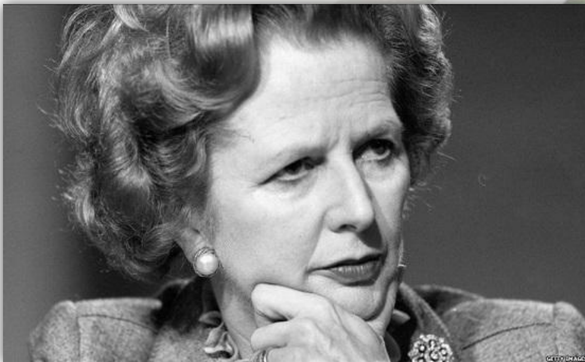
Маргарет Хильда ТЕТЧЕР