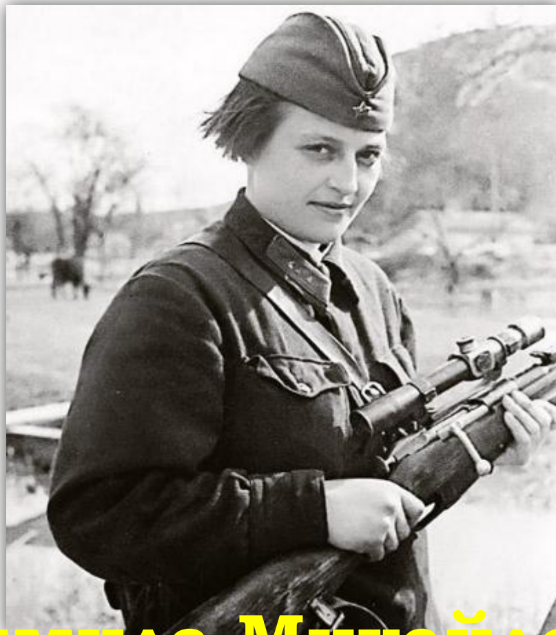
Людмила Михайловна ПАВЛИЧЕНКО