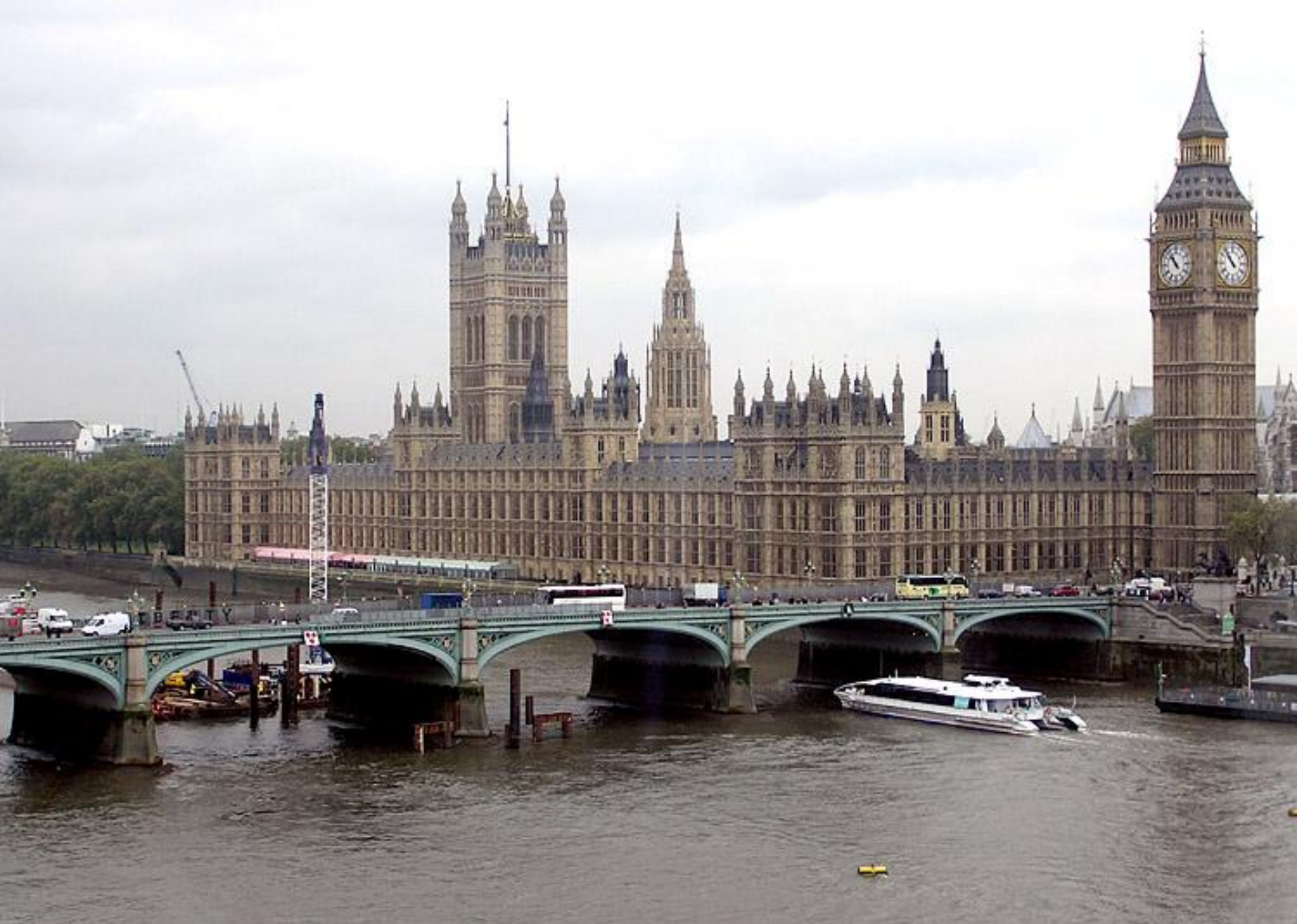
Вестминстерское аббатство и Тауер в