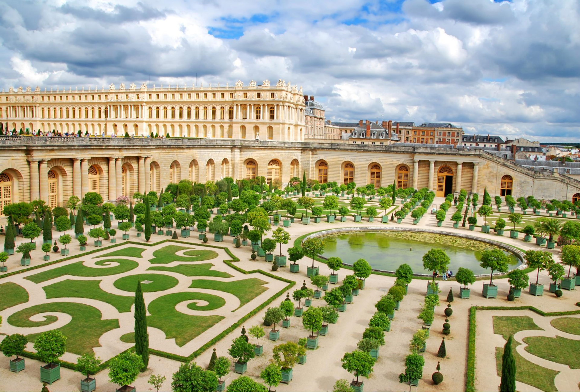
Версаль под Парижем во