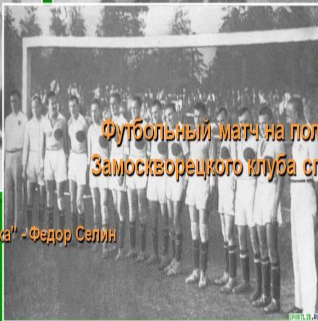
Сборная команда России.

Решающий год развития футбола в Москве - это 1909 г., когда создали Московскую футбольную лигу. По примеру Петербурга и Москвы футбольные клубы многих городов страны объединялись в футбольные лиги (Одесса, Харьков, Киев, Донбасс и др.).