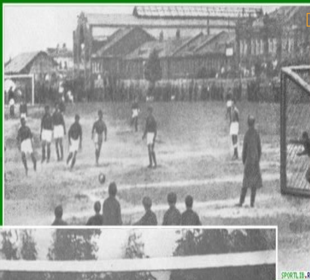
Футбольный матч на поле Замоскворецкого клуба спорта