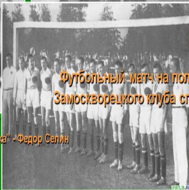
Сборная команда России.

Решающий год развития футбола в Москве - это 1909 г., когда создали Московскую футбольную лигу. По примеру Петербурга и Москвы футбольные клубы многих городов страны объединялись в футбольные лиги (Одесса, Харьков, Киев, Донбасс и др.).