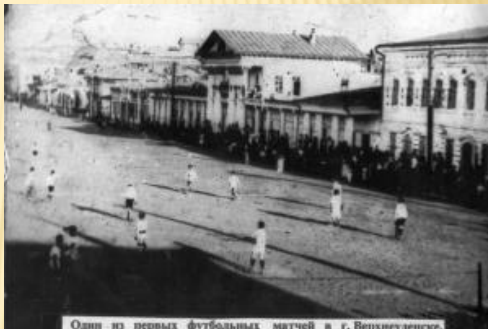
Один из первых футбольных матчей в г. Верхнеудинске.

Это случилось 31 июля 1915 года. В этот день с разрешения городских властей состоялся футбольный матч между местными командами «Спартак» и «Гладиатор».