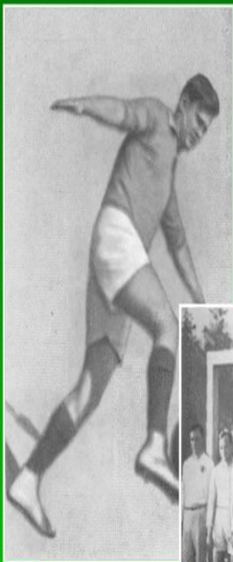
"Король воздуха" - Федор Селин