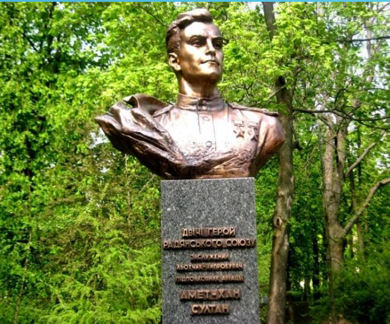
Бюст Амет-Хана Султана в Києве на аллеє Слави

ДВІЧІ ГЕРОИ РАДЯНСЬКОГО СОЮЗУ ЗАСЛУЖЕНИЙ ЛЮОТЧИК-ВІПРОБУВАЧ ПЕДЛОТКОВНИК АВІАЦІЇ АМЕТ-ХАН СУЛТАН