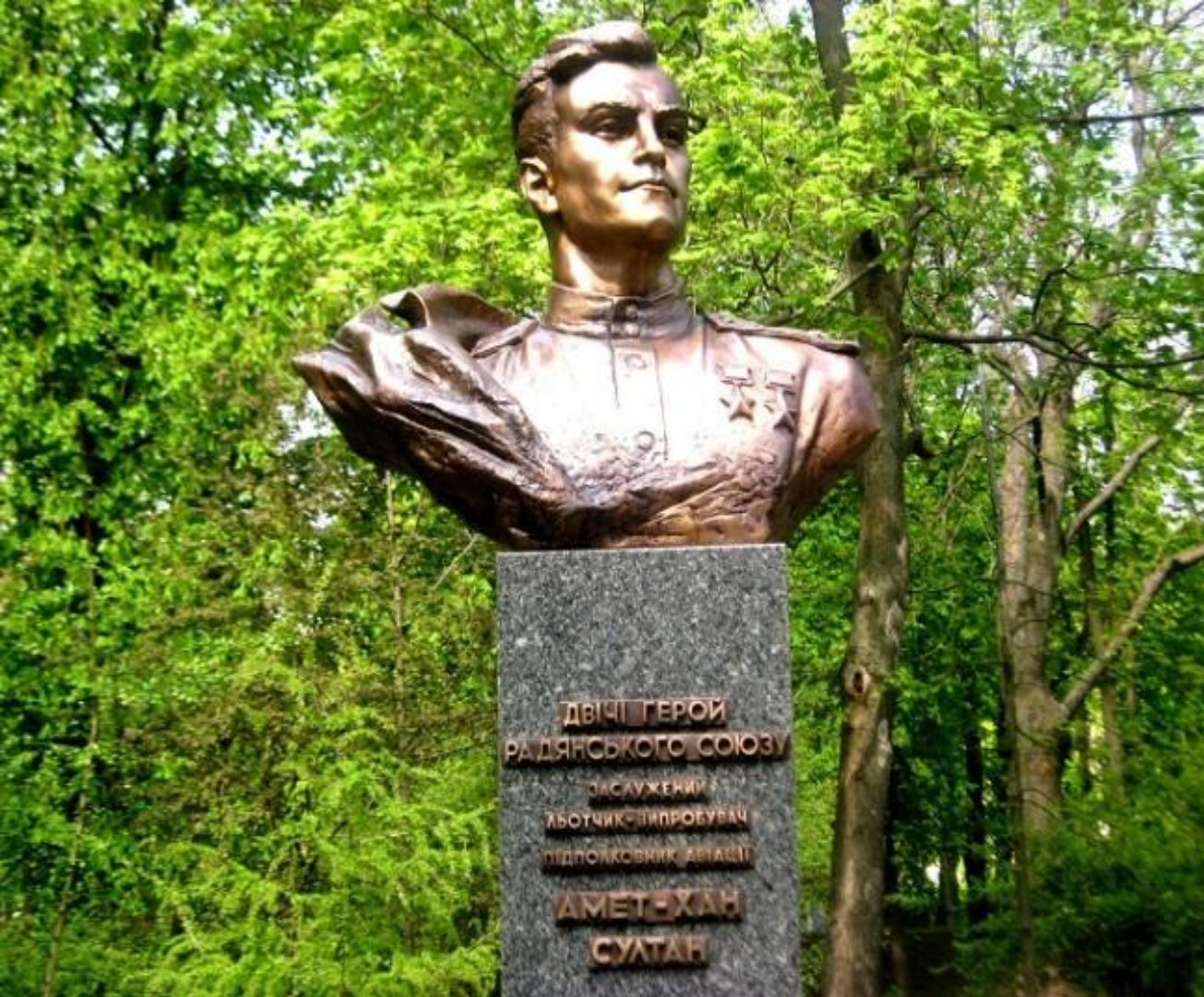
Бюст Амет-Хана Султана в Києве на аллее Славы