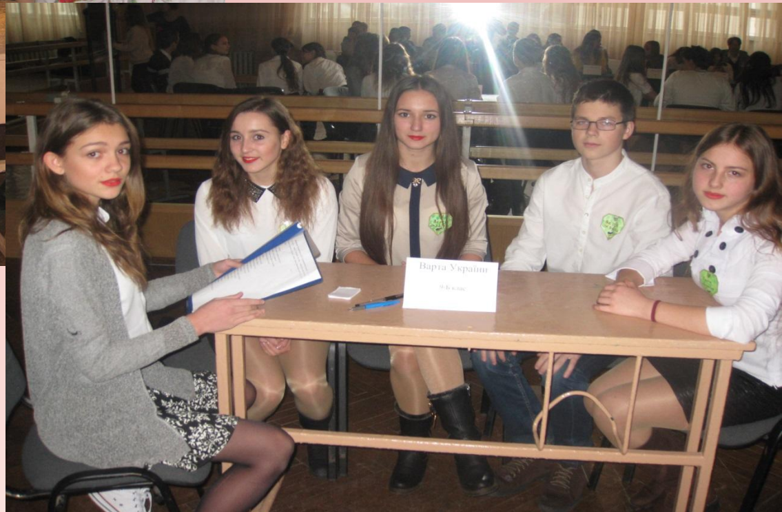
Варта України 9-В клас