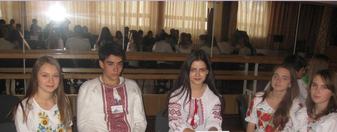
Праволуби 9-В клас