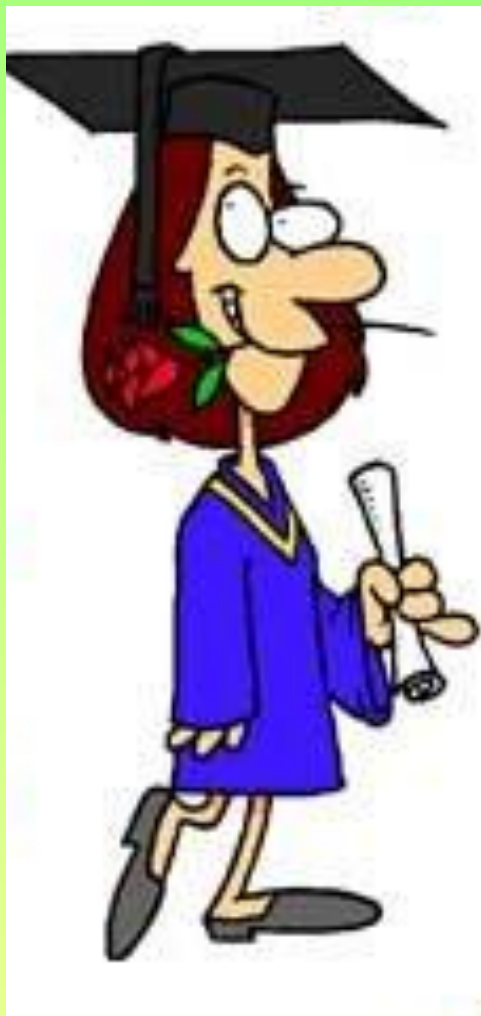
Классная руководительница Мариванна