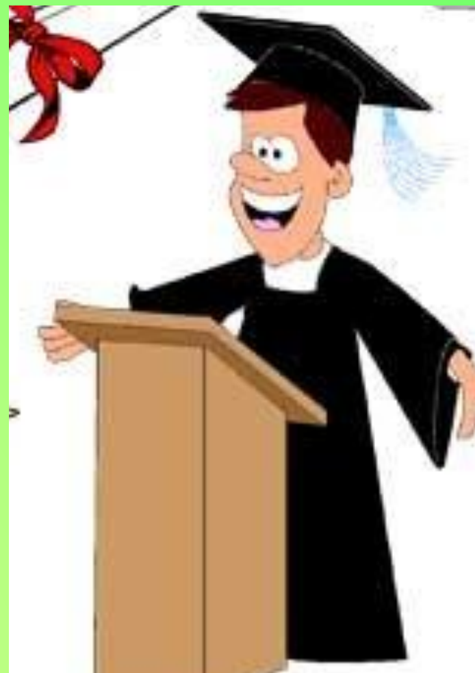
Профессор Умняга (очень интересуется вопросами ученического самоуправления)