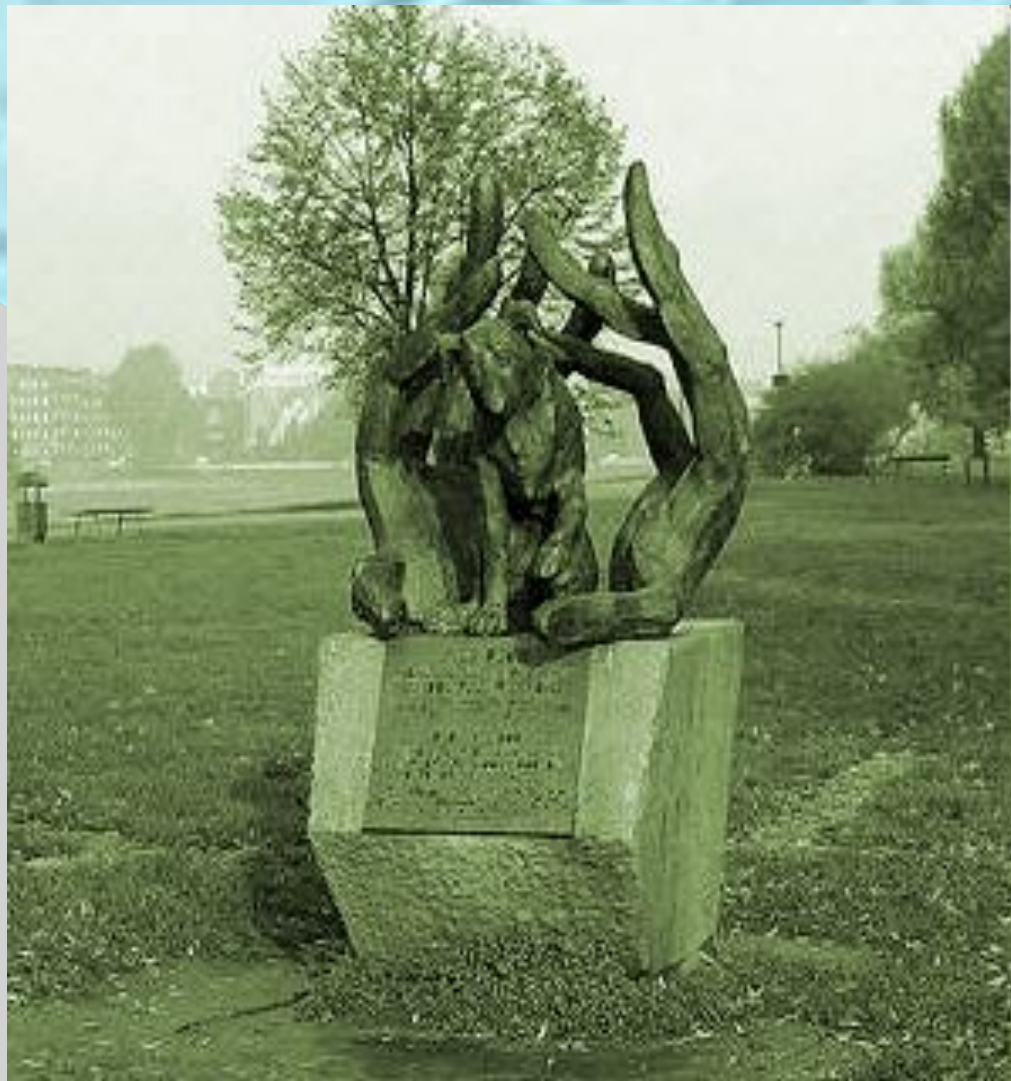
Памятник верному Джеку в Кракове