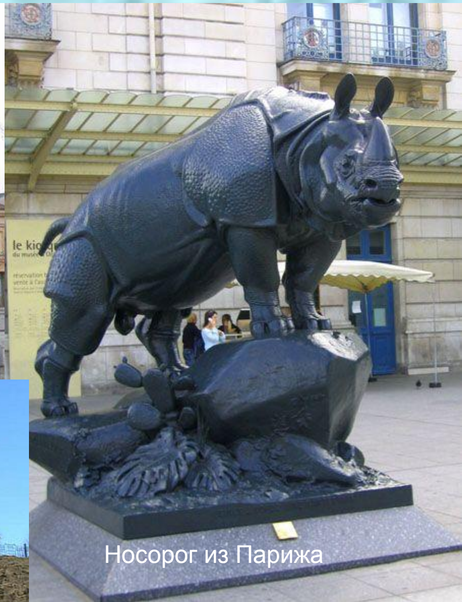
Носорог из Парижа