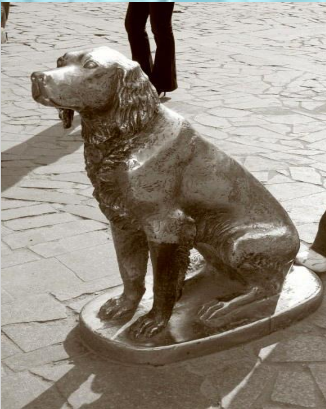
Памятник Белому Биму - Черное Ухо. Воронеж.