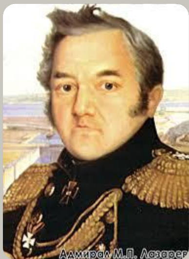
Адмирал М.П. Лазарев

Лазарев Михаил Петрович (1788 - 1851)-флотоводец и мореплаватель. Командующий Черноморским флотом.