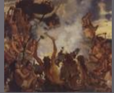
Каменный век. Детали фризa 2.