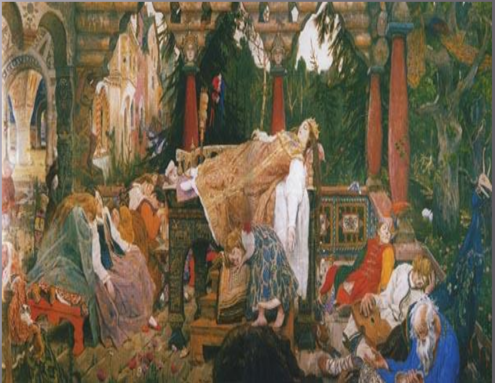
Спящая царевна 1900 год