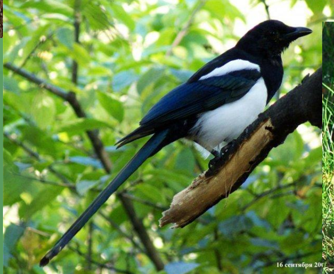
16 сентября 201