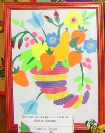
Коллективная работа 1 класса «Рог изобилия» Педагог - Блинова Нелли Тема: «Поздрав для мамы» Номинация: «Декоративно-прикладное творчество»