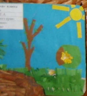
1-класс И.А. Край и