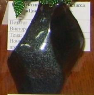
Коллективная работа 1 класса «Цветы» Педагог: Викторова Тема: «Поздрав для мамы» Номинация: «Декоративно-прикладное творчество»