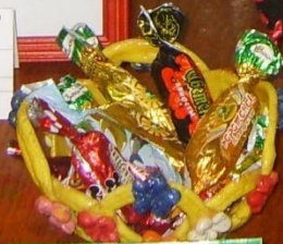
«Конфетница» коллективная работа 2 класса Педагог: Крюкова Е.Л.