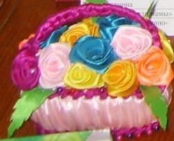
«Цветы в вазе» Коллективная работа 2 класса Педагог: Крюкова Е.Л.