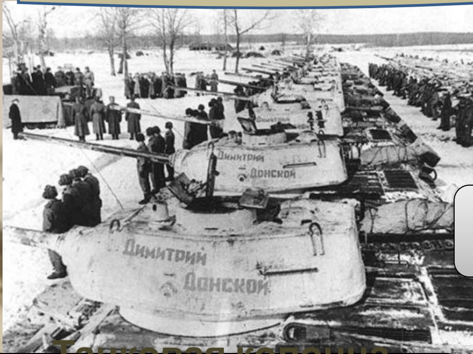
Танковая колонна имени Дмитрия Донского