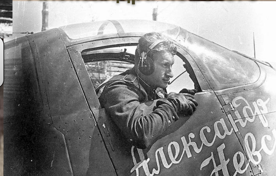
Авиационная эскадрилья имени Александра Невского