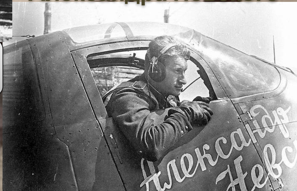
Авиационная эскадрилья имени Александра Невского