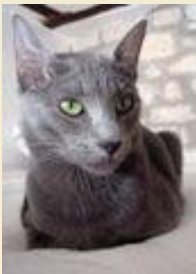
Русская голубая (Порода короткошёрстных кошек)