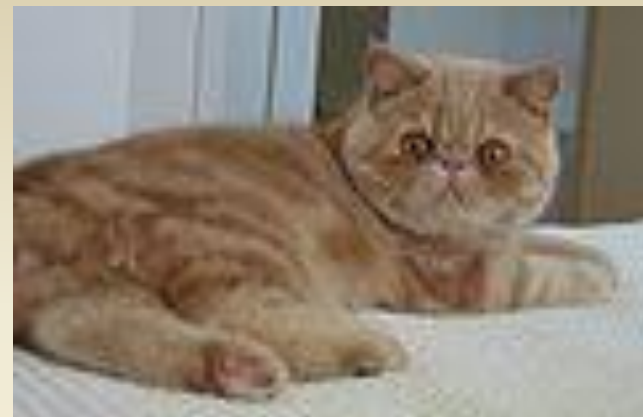
Экзот (Порода короткошёрстных кошек)