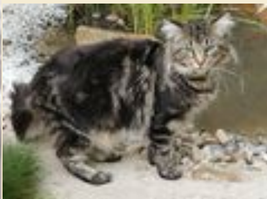
Мейн-кун (Порода полудлинношёрстных кошек)