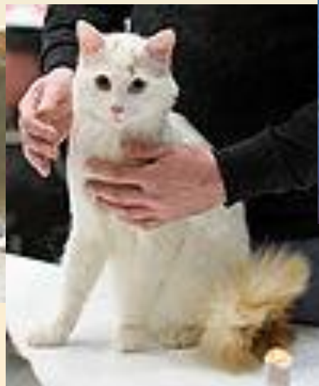
Турецкий Ван (Порода полудлинношёрстных кошек)