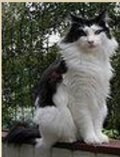
Норвежская лесная (Порода полудлинношёрстных кошек)