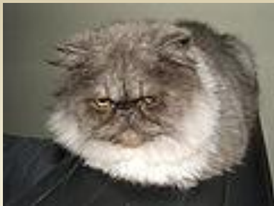
Персидская кошка (Порода длинношёрстных кошек)